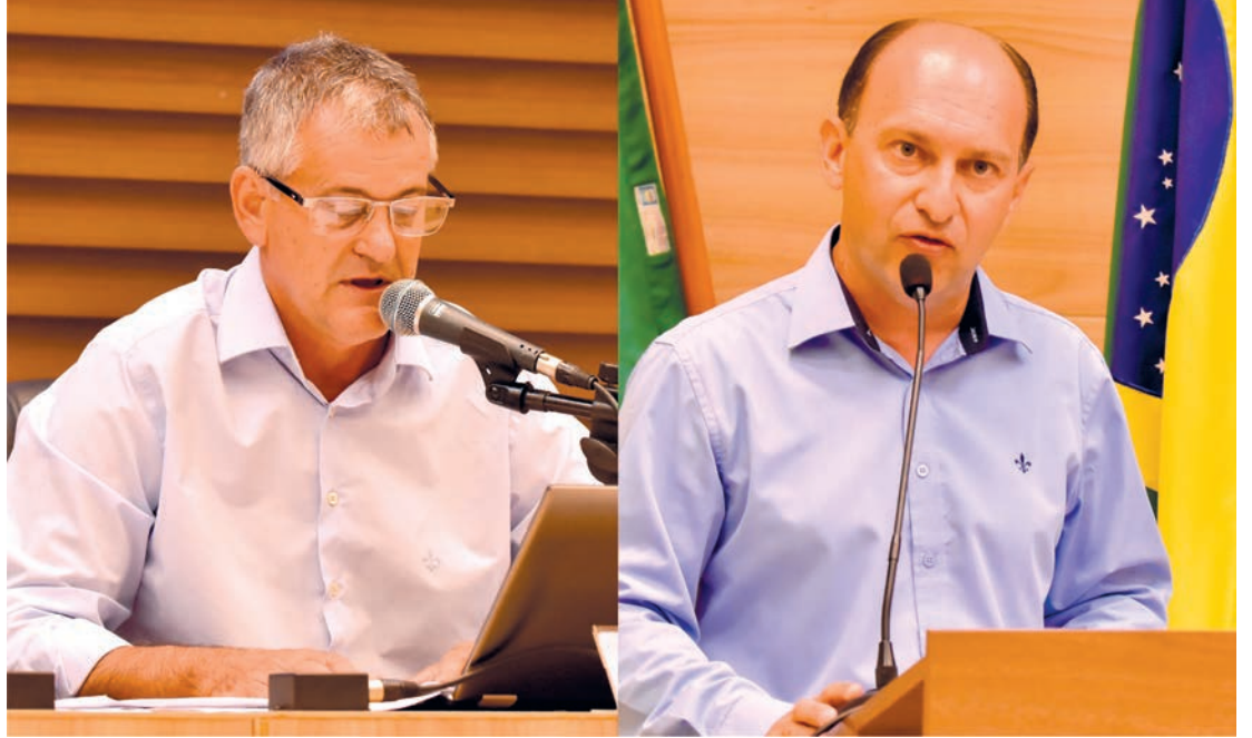
Os dois vereadores do Podemos votaram de forma contrária a recomendação do partido