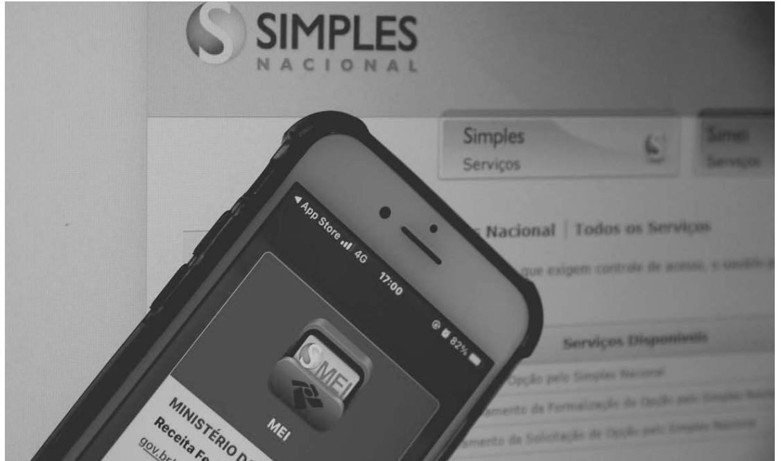
Empresas do regime ganham dois meses para regularizarem débitos