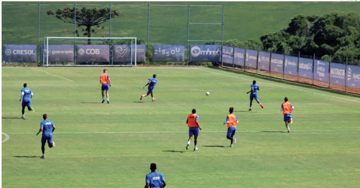
O Azuriz treinou antes de viajar para o seu primeiro compromisso no Estadual