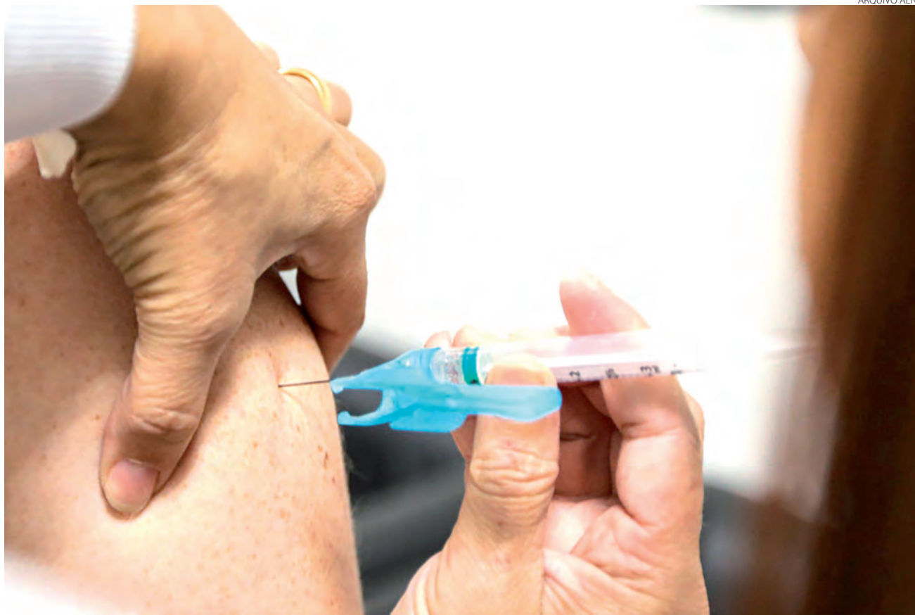
Orientação é que população tome suas doses de vacinas contra a covid-19 e contra a Influenza

Logo nos primeiros dias de 2022, os boletins epidemiológicos dos municípios da região Sudoeste, assim como de todo país, começaram a registrar mais um crescimento nos casos de covid-19. Desta vez, a contaminação desenfreada, referente ao vírus, está re-