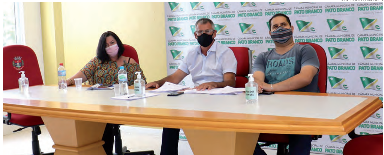
Comissão que foi formada em outubro de 2021 apresentou dois relatórios do Caso Cantu

Biruba afirmou que devido informações que che-