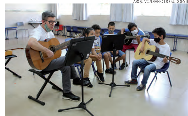
Entidade oferece várias atividades artísticas e atendimentos

Para adquirir o carnê é necessário entrar em contato com a instituição por meio do telefone (46) 9.9981 - 9983. As doações podem ser feitas tanto por pessoas quanto por empresas.