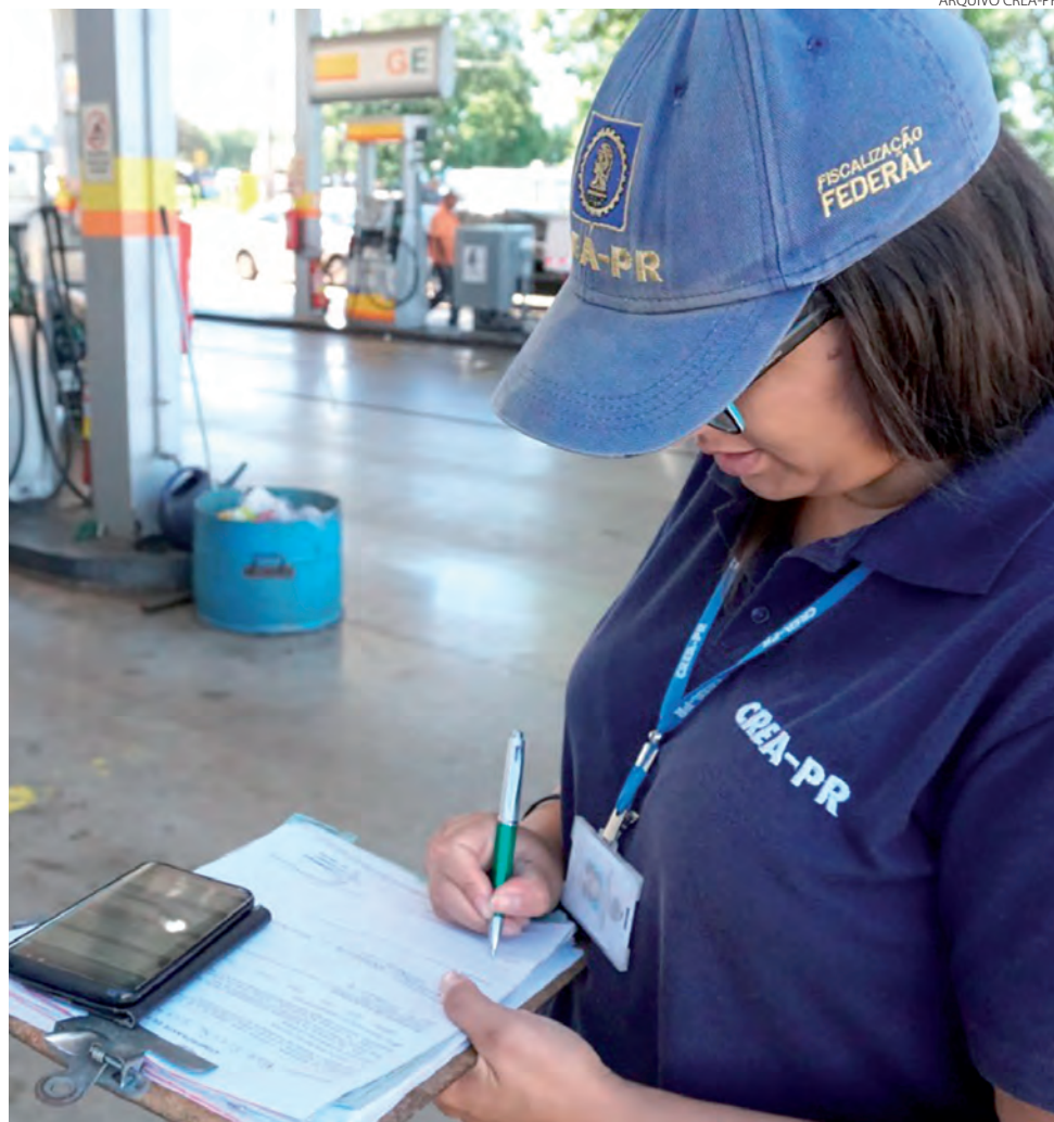
Em ano marcado pela pandemia, as fiscalizações do exercício profissional nas Engenharias, Agronomia e Geociências chegaram a 2.785 no Sudoeste

O Livro de Ordem, ferramenta digital destinada ao preenchimento por parte dos profissionais, foi mais uma novidade. “Ainda houve a implantação do atendimento on-line, com possibilidade de envio de documentos digitalizados pelos clientes diretamente