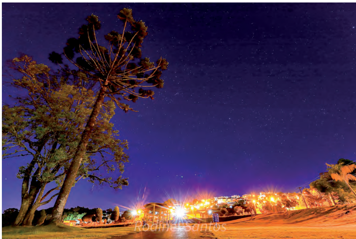
Bacia de contenção do bairro Pinheirinho