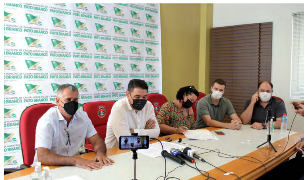
Anúncio da data do julgamento foi feito com presença dos membros da Mesa Diretora

O presidente também relatou que será respeitada a capacidade do plenário, levando em conta as restrições impostas pela pandemia de covid-19. O que limitará a 81 pessoas no plenário do Legislativo. (MR)