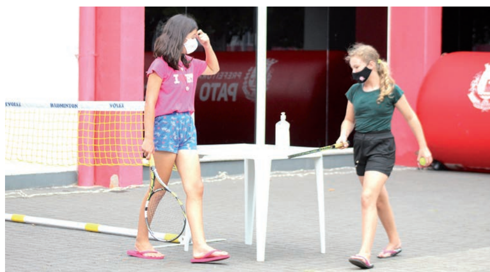
Mini esportes são alguns dos atrativos