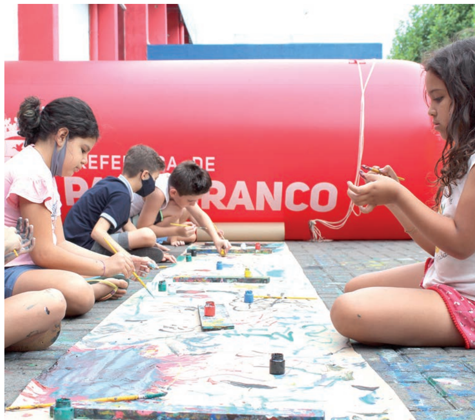
Pintura em papel kraft desperta potencial criativo das crianças

Importante: Em caso de chuva, as atividades são suspensas temporariamente