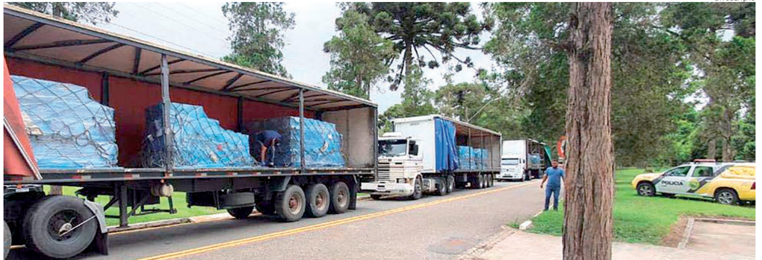
O investimento em cada arma de fogo foi de aproximadamente R$ 2,5 mil, conforme a variação do euro

Mais 9,8 mil pistolas modelo 9mm, de marca Beretta, de origem italiana, chegaram ao Paraná em dois lotes. Um na segunda-feira (10) e o outro no fim da tarde da última sexta-feira (7).