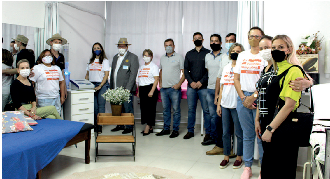
Doação de equipamento foi feita pelo Rotary Club Pato Branco Sul e Fundação Rotária

"O trabalho de reabilitação física vem sendo desenvolvido há anos no Gama, mas elas também têm muitos problemas de dor, queimadura de pele depois da radioterapia e sem-