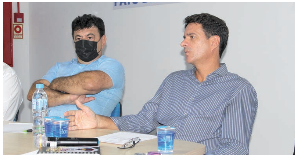
Delano afirmou que a Liga tem o objetivo de tornar a competição mais participativa, com mais equipes de fora do eixo Rio de Janeiro, São Paulo e Minas Gerais

Na ocasião, foram apresentados alguns dados sobre o desenvolvimento do projeto do Pato Basquete, que na