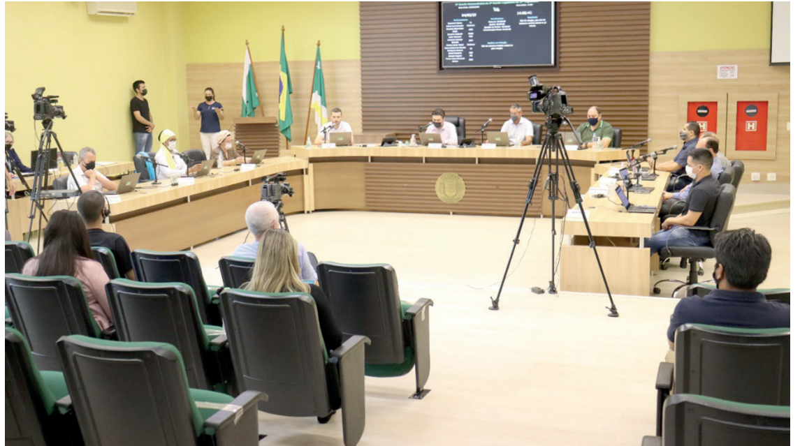
A sessão extraordinária foi realizada na tarde de sexta-feira (4)