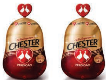
Chester Perdígão Tradicional Kg