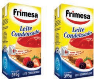
Leite Condensado Frimesa Tradicional 395g