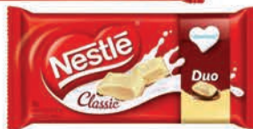
Chocolate Barra Nestlé 80g a 90g