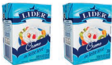
Creme de Leite Lider Leve 17% Gordura 200g