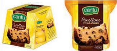
Panettone Cantu Sachê e Caixa Gotas Chocolate 400g