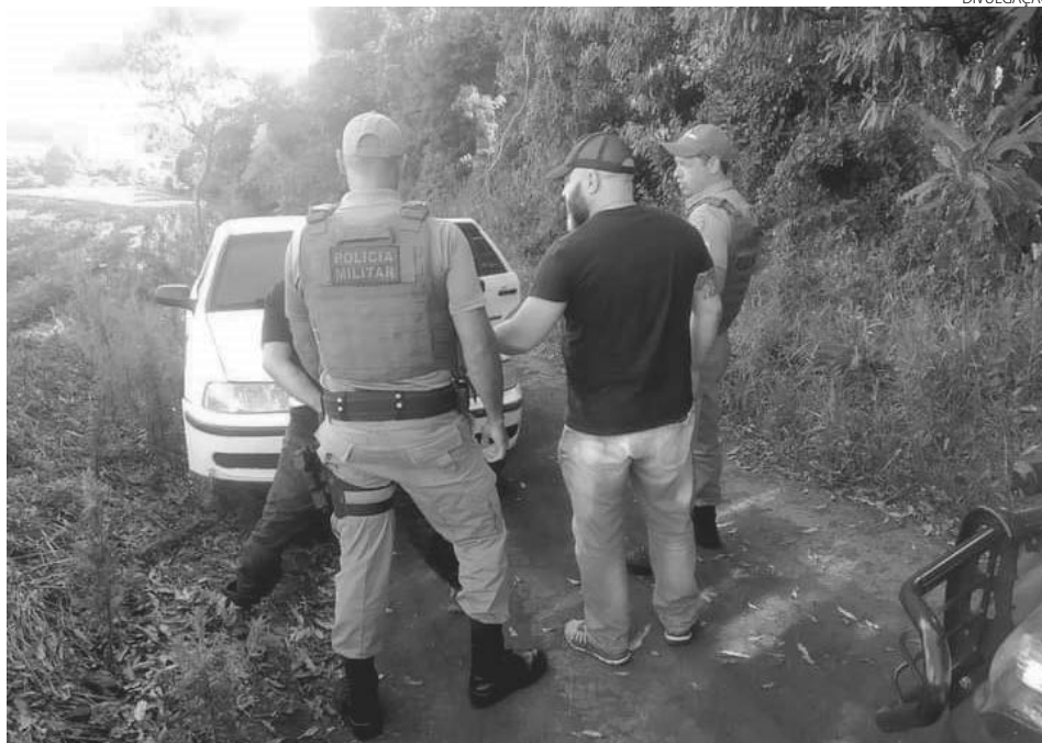
Momento em que o acusado do crime foi preso em Abelardo Luz (SC)

Policiais do Batalhão de Polícia de Fronteira (BPFron) realizavam patrulhamento, terça-feira, na cidade de Foz do Iguaçu, durante Operação Hórus, quando abordaram um estabelecimento comercial. No local foram encontrados 350 pacotes de cigarros contrabandeados do Paraguai. O proprietário do contrabando foi identificado e liberado. Os cigarros foram encaminhados para a Receita Federal em Foz do Iguaçu.