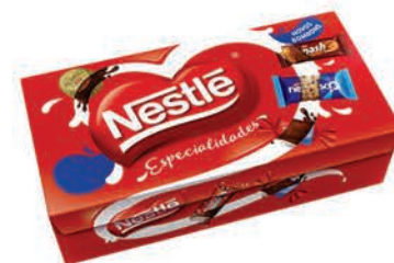
Bombom Nestlé Especialidades 251g