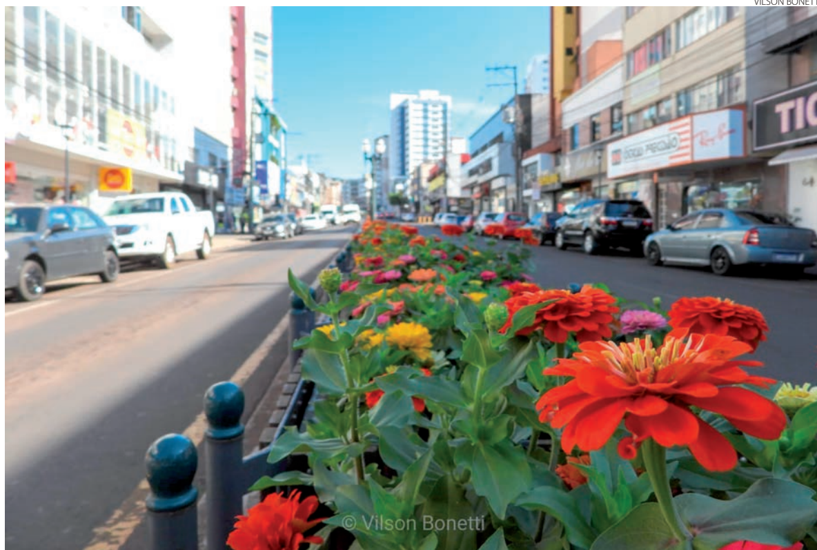
O verão está colorido pelas flores da avenida Tupi, que embelezam o centro da cidade. A estação mais quente do ano teve início nessa terça-feira (21)