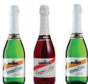
Filtro Espuma Prata 660ml