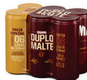
Cerveja Brahma Duplo Malte C/6 Latas 310ml