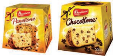
Panettone Bauducco Frutas e Chocottone Chocolate 500g