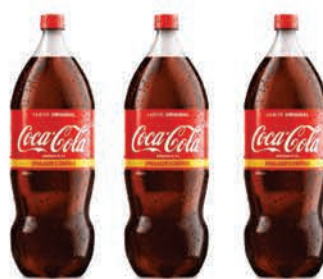
Refrigerante Coca-Cola Menos Açúcar 2,5L