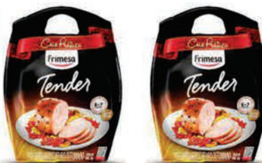
Tender Presunto Frimesa Kg