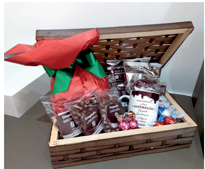
As cestas são opções de presentes da loja de chocolates do Gama

A loja de chocolates do Gama fica na sede da Casa de Apoio, localizada na rua Teófilo Augusto Loiola, nº 360, bairro Sambugaro, em Pato Branco.