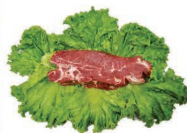
Filé Agulha Bovino Kg