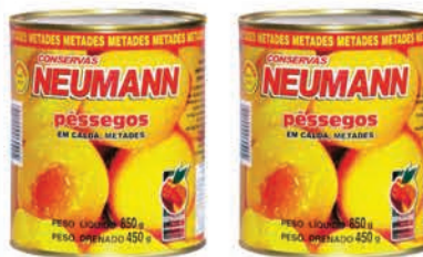
Pêssego Calda Neumann Metades 450g