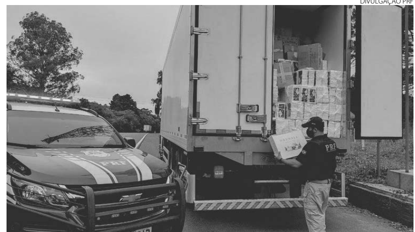
O vinho estava sendo transportado de Manguueirinha para Curitiba

O crime de descaminho que consiste em iludir, no todo ou em parte, o pagamento de direito ou imposto devido pela entrada, pela saída ou pelo consumo de mercadoria, tem pena de reclusão de um a quatro anos. (Agência PRF)