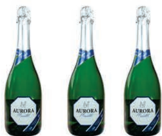
Espumante Aurora Moscatel 750ml