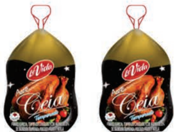
Ave Ceia Levida Kg