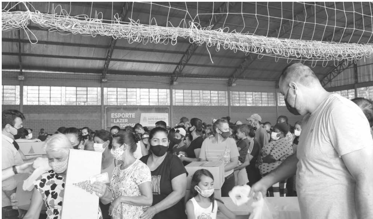
Cestas foram entregues a mais de duas mil famílias de Pato Branco