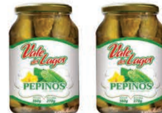
Pepino Conserva Vale dos Lagos 270g