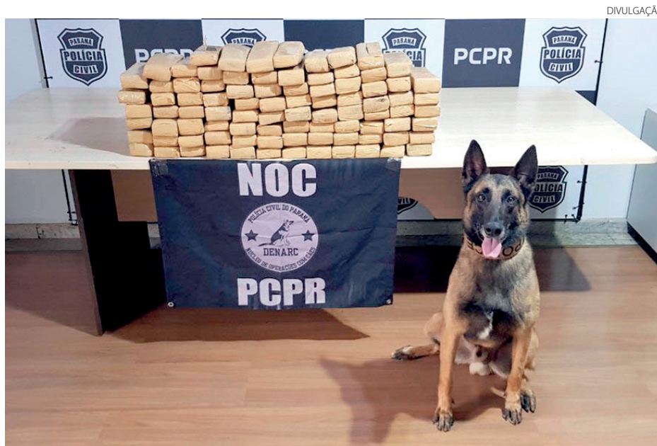
A maior parte das drogas apreendidas com a utilização de cães foi maconha

Em situações distintas, policiais militares do 4º Batalhão de Polícia Militar (4º BPM), pertencente ao 3º Comando Regional da PM (3º CRPM), prenderam dois homens e apreenderam 194 pedras de crack e 20 comprimidos de ecstasy. As ações policiais aconteceram nas cidades de Marialva e Maringá. De acordo com as informações repassadas pela unidade, em Marialva, os policiais militares estavam em patrulhamento, quando abordaram um rapaz, de 22 anos, que estava em uma motocicleta, com 20 comprimidos de ecstasy. Já na cidade de Maringá, uma equipe policial estava em patrulhamento, quando avistou dois homens em atitude suspeita, que, assim que eles perceberam a presença policial, tentaram fugir. Um deles, de 29 anos, foi detido e com ele localizadas 194 pedras de crack.