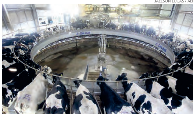
Francisco Beltrão é o quarto município do Paraná a mais produzir leite

Por fim, Santo Antônio do Sudoeste foi destaque na produção de ovos de galinha. Conforme o diagnóstico, o município é o terceiro do Paraná com maior VPB