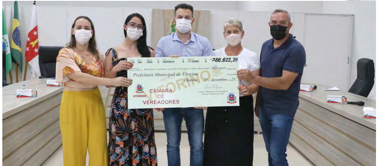
O Legislativo repassou recurso excedente ao Executivo de Vitorino na terça-feira (21)