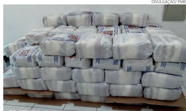
Os donativos serão destinados para as famílias atendidas conforme os critérios do programa "Família Paranaense"

As famílias serão atendidas pela equipe técnica do Cras. Bem como, as cestas básicas serão destinadas às famílias participantes do Programa Família Paranaense e famílias que