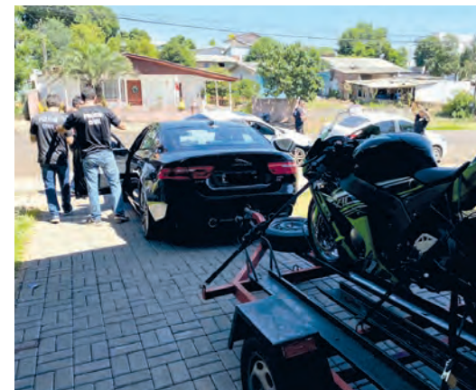
O patrimônio do acusado entre lojas, veículos de luxo, bens e propriedades supera R$ 5 milhões

Civil tem agora um prazo de 30 dias para concluir as investigações, podendo este prazo ser prorrogado pelo juiz. (Assessoria PCSC)