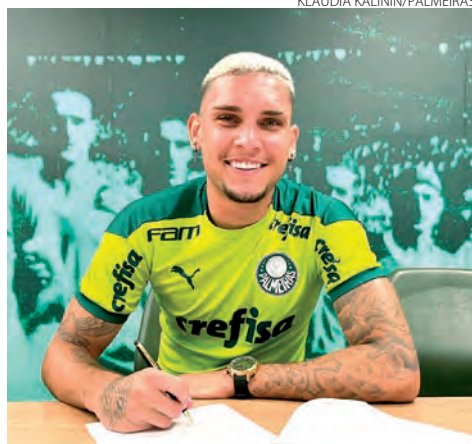
Principal destaque do Botafogo na temporada 2021, o jogador assinou com o Verdão até o fim de 2026