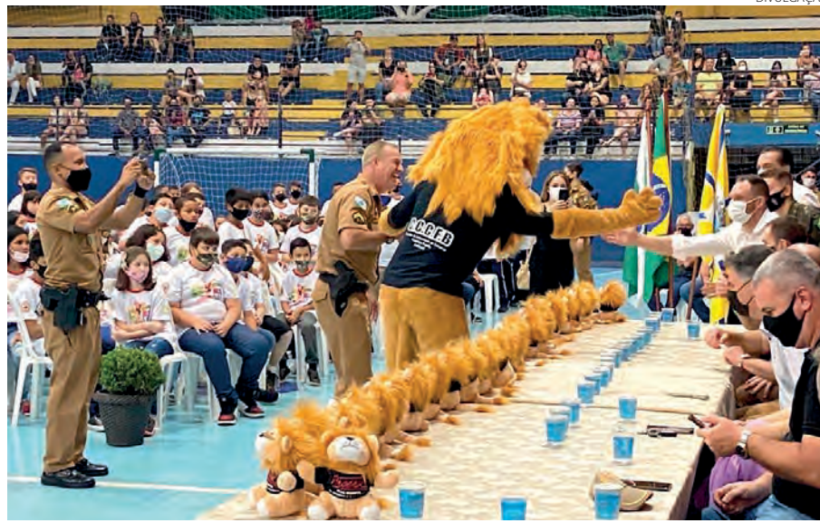
Atividades do Proerd foram desenvolvidas com estudantes de 13 escolas

Na quinta-feira (9), aconteceu no Ginásio Arrudão a formatura do Programa Educacional de Resistência às Drogas e à Violência (Proerd). Neste ano, as aulas retornaram em Francisco Beltrão, após dois anos paradas devido a pandemia de covid-19. Ao todo 650 estudantes de 5º ano, de 12 escolas públicas municipais e uma da rede privada, foram formados.