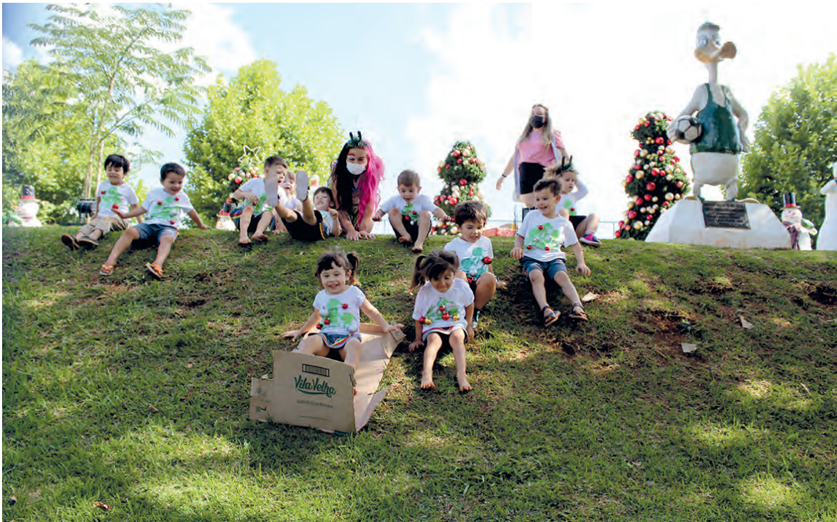
A turminha do Jardim I do Colégio Integral de Pato Branco aproveitou a tarde da sexta-feira (10), no Largo da Liberdade, em clima de muita diversão e com um gostinho de Natal