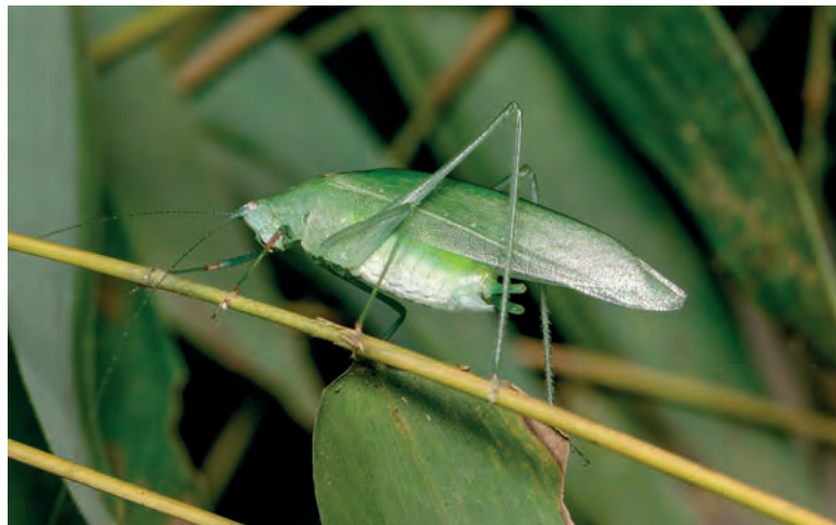
A Anaulacomera angelinae , uma das espécies descobertas em Renascença

Segundo Fianco, o trabalho de identificação começa em campo. À noite, os insetos são atraídos com o auxílio de uma lâmpada e coletados. “Algumas delas foram atraídas até pela luz de dentro de