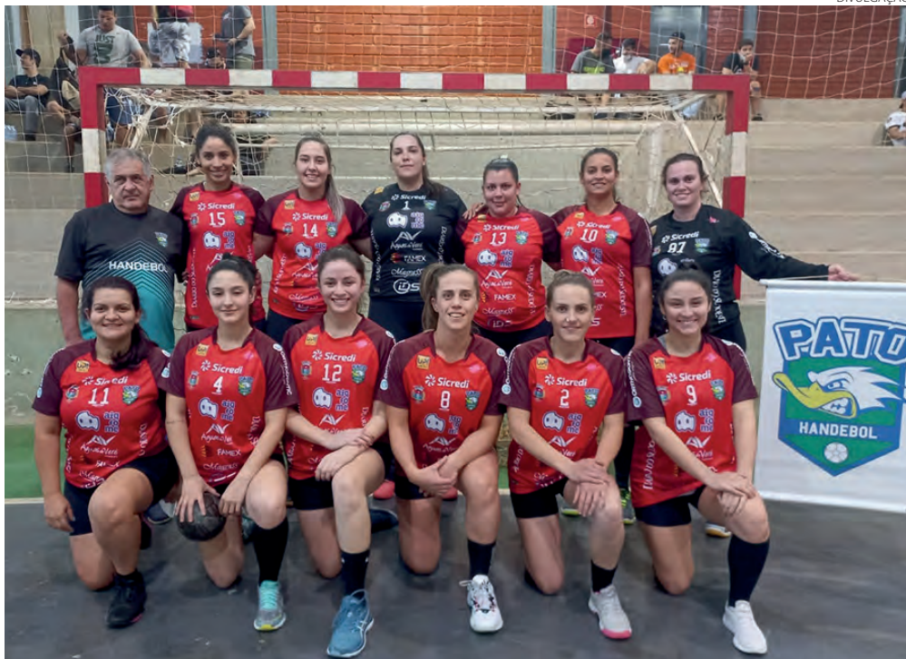
Equipe feminina de Pato Branco, vai disputar a chave ouro do estadual em 2022

Além da pior colocação desde 2003, o São Paulo acumulou a pior pontuação (48), o menor número de vitórias (11), o menor número de gols (31) e o pior saldo (menos oito). Na quinta-feira, o técnico Rogério Ceni comentou sobre seu futuro no clube após a derrota para o América-MG e novamente voltou a falar da necessidade de mais investimentos na montagem da equipe. (Assessoria)