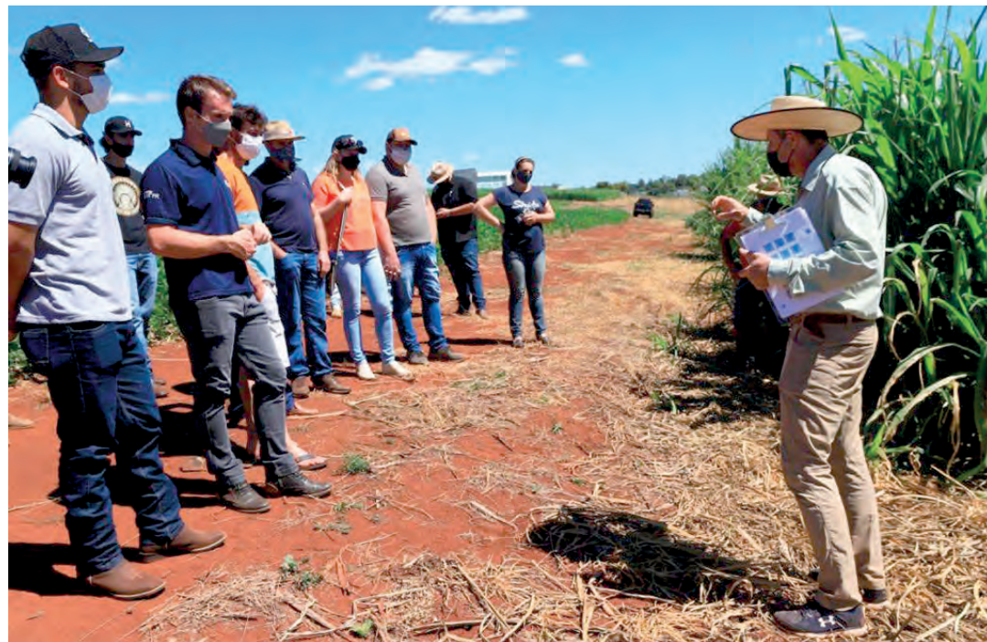
Iniciativa busca incentivar a cadeia produtiva do leite

Com o objetivo de fortalecer a cadeia produtiva leiteira de Pato Branco, a Secretaria Municipal de Agricultura, realizou na quinta-feira (8), um dia de campo sobre plantas forrageiras. A ação contou com a parceria da Universidade Tecnológica Fede-