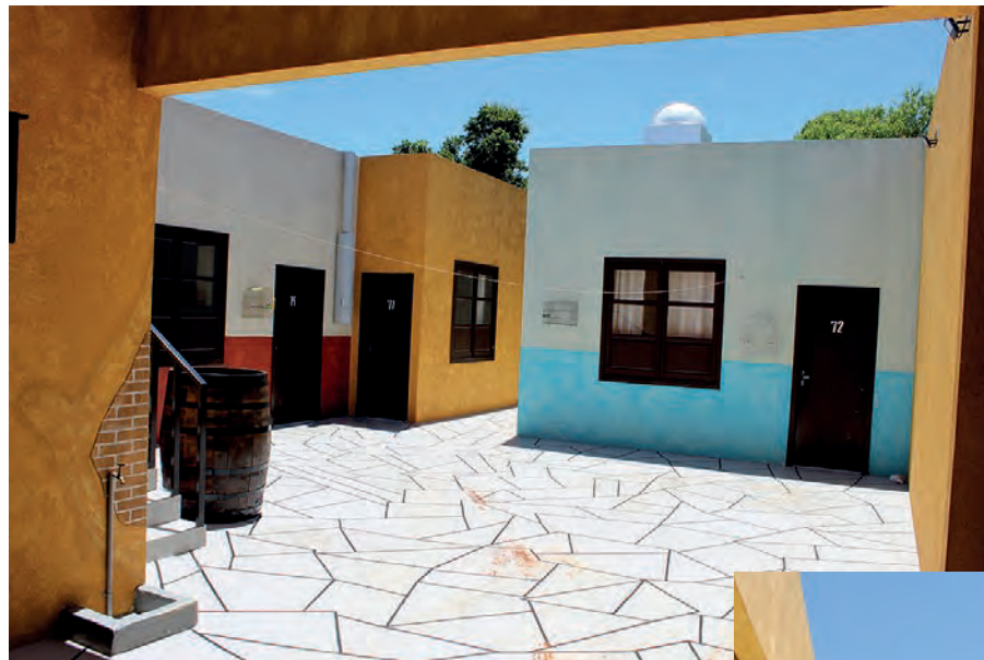
O cenário da construção é inspirado no episódio 118 do seriado, “Ser Pintor É Uma Questão De Talento, parte 1”

O cenário da construção é inspirado no episódio 118 do seriado, “Ser Pintor