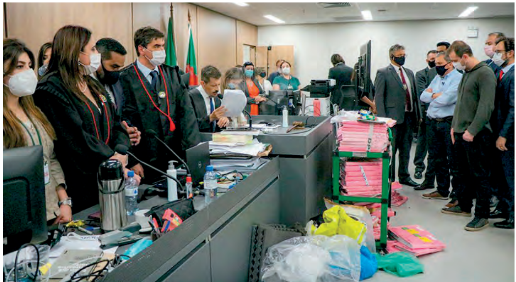
Júri foi o mais longo da história da Justiça do Rio Grande do Sul

Mesmo condenados, os quatro não saíram algemados do Fórum de Porto Alegre,