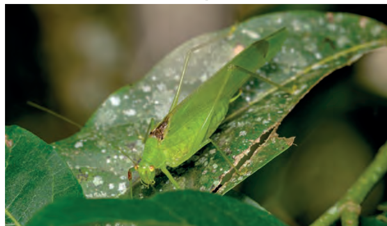
Anaulacomera ( Anallomes ) arlindoi . Espécimes foram identificadas na comunidade do Canela

Fianco conta que deve seguir trabalhando na pesquisa de esperanças, analisando regiões como a Serra do Mar e o Parque Nacional do Iguaçu, onde ele e um grupo de pesquisadores realizaram uma expedição nesta semana.