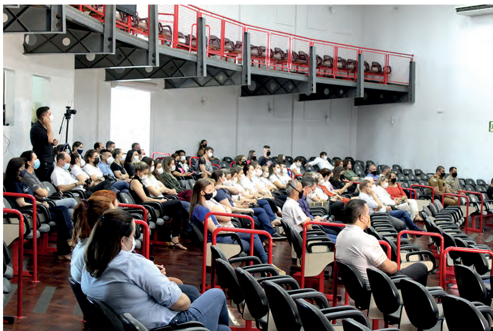
De março de 2020 a novembro de 2021, foram 14.431 casos suspeitos ou confirmados e 1.171 internamentos

Todos os homenageados receberam certificados do Dia de Agradecer do Hospital Policlínica. Os interessados em conhecer mais detalhes sobre os projetos e ações podem acessar o site do hospital ( hospitalpoliclinica.org.br ).