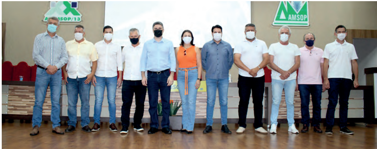
Membros da nova diretoria da Amsop

O novo presidente destacou, também, que uma de suas prioridades é a continuidade do projeto em parceria com a Itaipu Binacional, para o calçamento com pedras irregulares de quatro quilômetros por município. As obras, que totalizam