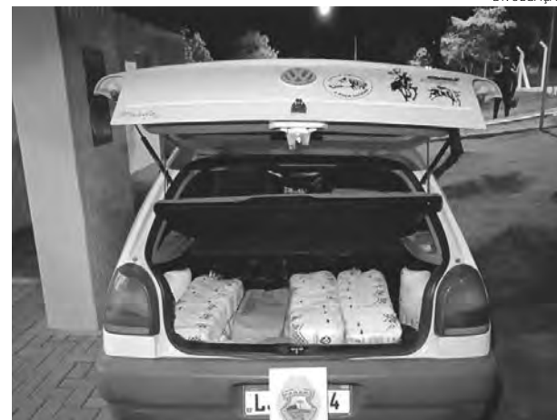
O Gol carregado com açúcar estava com placa adulterada

O açúcar foi apreendido e entregue na Delegacia da Receita Federal e o automóvel retido. Já o casal foi preso pelo crime de adulteração de sinal identificador de veículo. O homem e a mulher foram entregues na Delegacia da Polícia Civil de Santo Antônio do Sudoeste para as providências cabíveis ao fato. (AB)