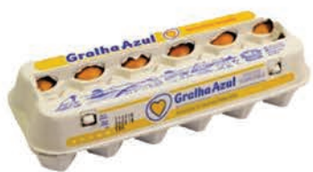
Ovos Vermelho Graalha Azul Dúzia