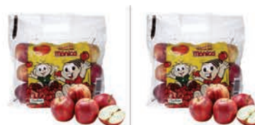
Maçã Escolinha Turma da Mônica 1Kg