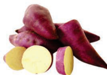
Batata Doce Roxa Kg