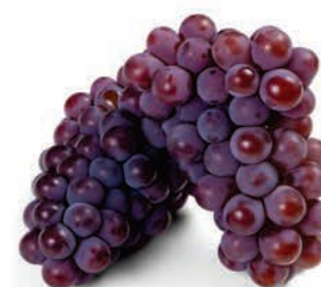
Uva Rosada Kg