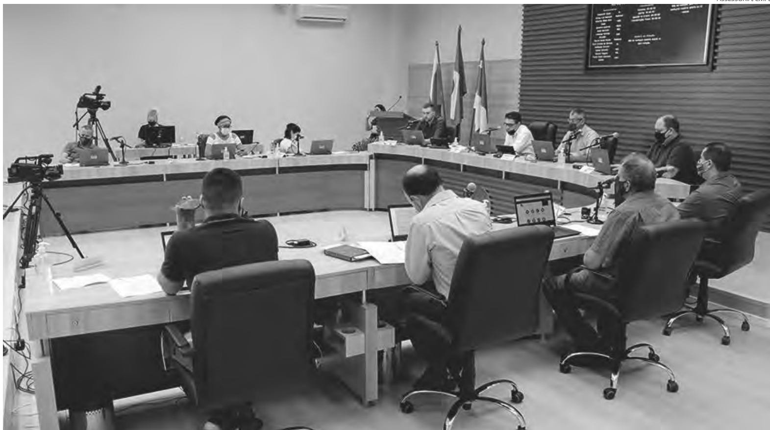
A primeira sessão ordinária do ano, da Câmara de Pato Branco, foi realizada nessa quarta-feira (2)