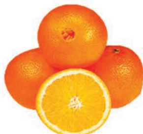
Laranja Bahia Importada Kg