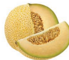
Melão Orange Rendado Cantaloupe Kg