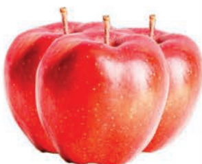
Maçã Importada Argentina Kg