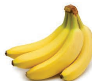
Banana Caturra Kg