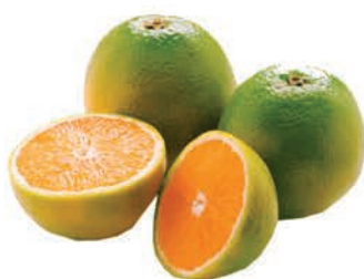
Laranja Pera Trad. Kg