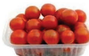
Tomate Cereja Verdura e Vida Bandeja 200g