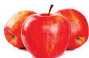
Maçã Gala Kg