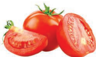
Tomate Longa Vida Kg