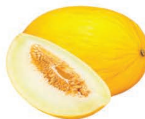
Melão Amarelo Brasil Kg