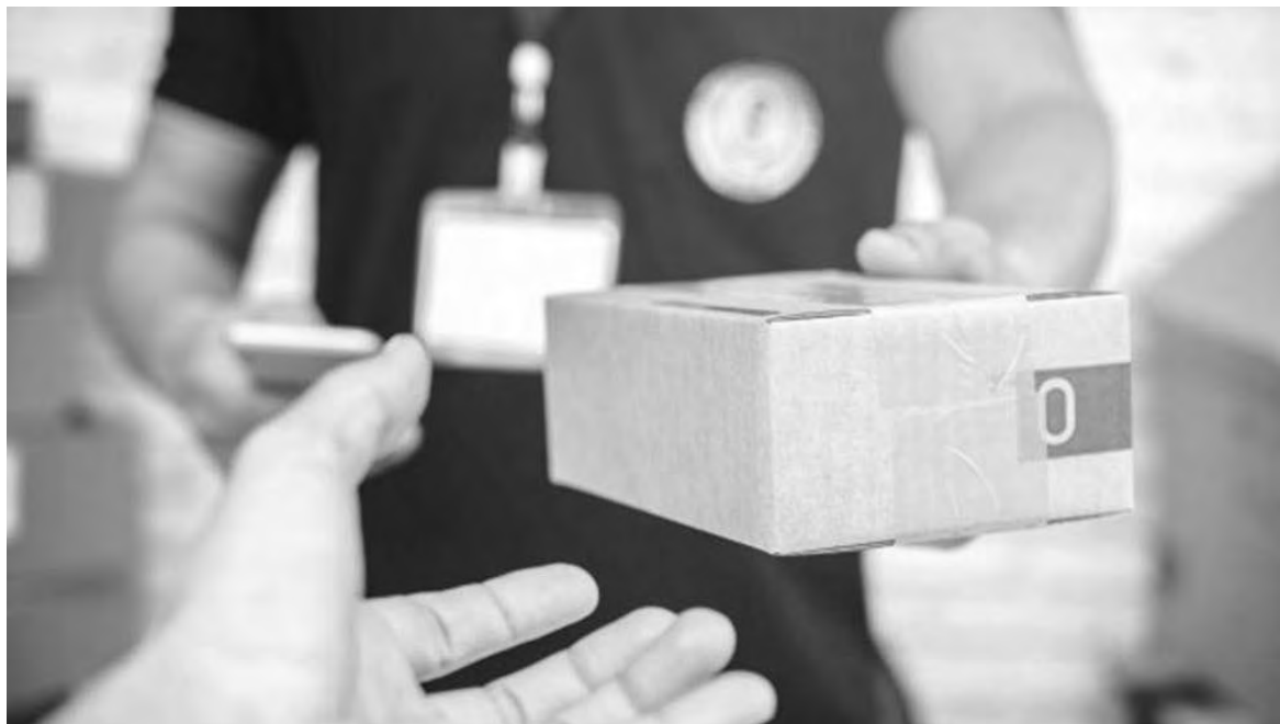
Relatório global da Kantar indica a volta dos padrões de compra do pré-pandemia em todo o mundo, com e-commerce experimentando desaceleração

Em todos os países as vendas de bens de consumo massivo via e-commerce desaceleraram no último ano com o avanço da imunização, exceto na China, que, surpreendentemente, viu um salto de 22,5% de share de mercado no 1º trimestre de 2021 para 28,6% no 3º trimestre. Em termos de penetração do comércio online, o destaque foi o Brasil, que passou de 4% em 2019 para 13% em 2021, devido à conquista de clientes fiéis a esse canal, atingindo a marca de 13% de compradores online dizendo ter usado o e-commerce