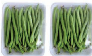
Vagem Lotti Bandeja 300g