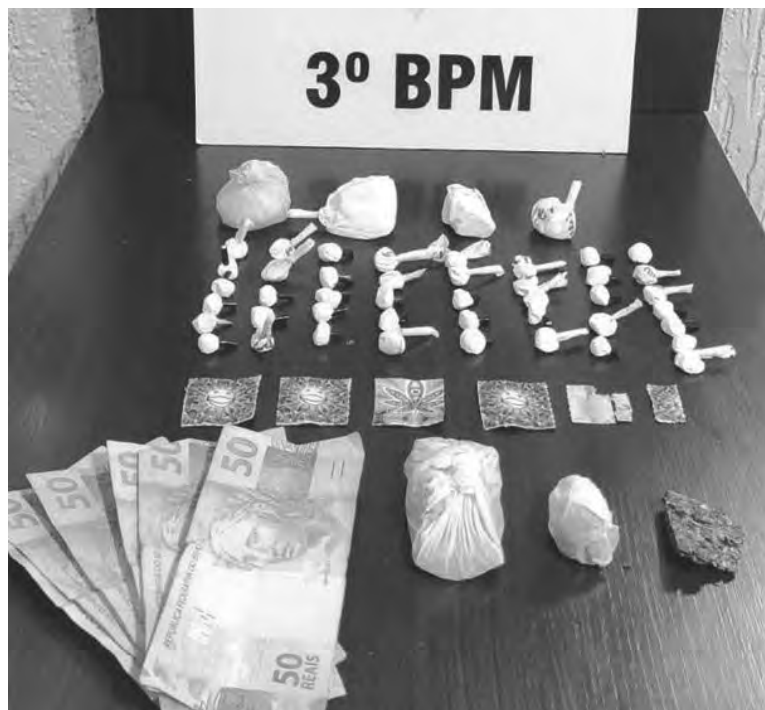
Foram apreendidos crack, cocaína, ecstasy, maconha e LSD

Diante da suspeita de que os dois ocupantes do automóvel teriam adquirido as drogas para o consumo, a Agência Local de Inteligência (ALI) levantou informa-