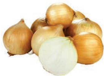
Cebola Nacional Kg