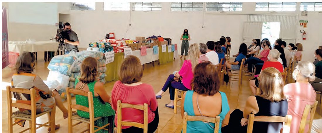
Números foram apresentados em prestação de contas

Segundo ela, a meta para este ano é fabricar uma quantidade ainda maior, para atender toda a demanda pelos produtos. "Quando chega novembro, dezembro, muita gente procura pelas bolachas e já não temos mais. Então nós já iniciamos uma lista de quem quer encomendar bolachas