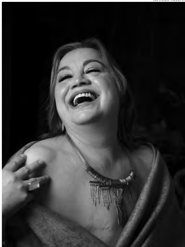
Exposição fotográfica do Grupo Gama integra a programação