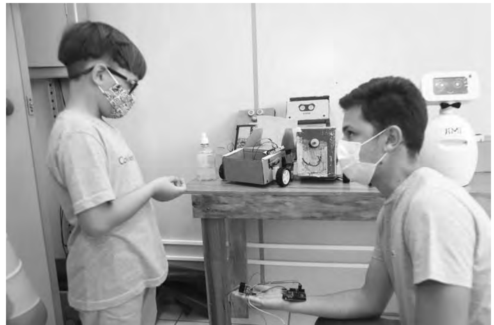
Projeto de robótica consiste na implantação dos Laboratórios de Tecnologia e Robótica no Sudoeste

O Parque ficou aberto na sexta das 8h às 12h, das 13h30 às 17h e das 18h30 às 21h30. Já no sábado, as portas abriram às 13h30, ficando até às 21h30. Foram realizadas exposições de profissões do futuro, projetos da prefeitura, observações do céu, espaço astronômico, mostra de games, universidades, sala cosplay e teatro, estufa urbana, Sebrae