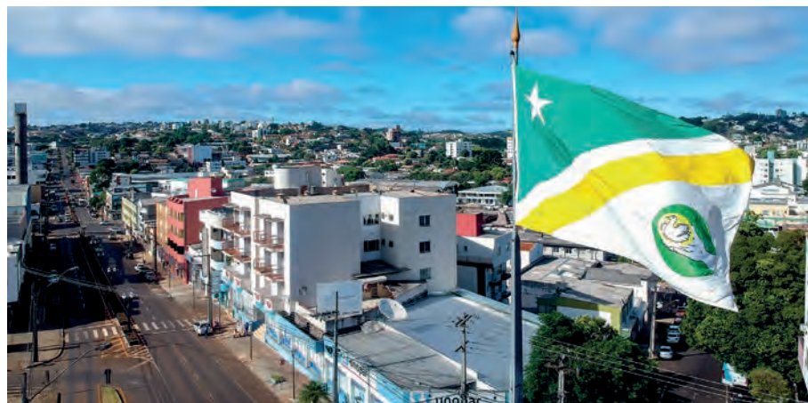
Encontro busca auxiliar os municípios na implementação da Agenda 2030

Paraná (Amsop), a Prefeitura Municipal de Pato Branco e a Casa Civil do Governo do Estado.