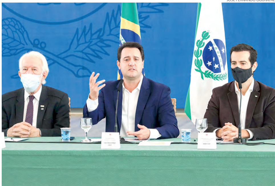
Pacote foi apresentado na segunda-feira no Palácio Iguazu

Ratinho Junior lembrou que essa é mais uma medida na estratégia de fazer com que o Paraná tenha a melhor educação do Brasil – o Estado saltou do 7º para o 3º lugar no ranking nacional segundo levantamento mais recente do Índice de Desenvolvimento da Educação Básica (Ideb). Ele citou, ainda, programas já implementados pela rede pública, como o oferecimento de aulas de robótica, programa-