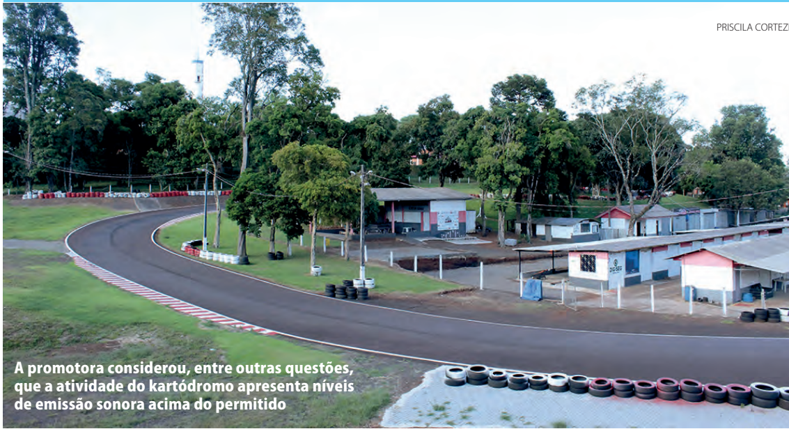
A promotora considerou, entre outras questões, que a atividade do kartódromo apresenta níveis de emissão sonora acima do permitido