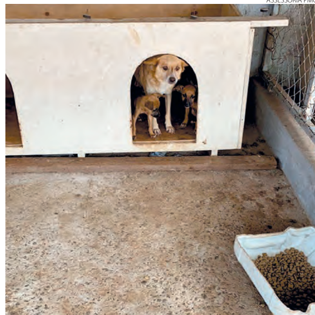
Abandonada no almoxarifado da prefeitura, cadelinha estará a disposição para adoção, assim como seus filhotes

Em Clevelândia, as ações referentes ao Dezembro Verde seguem como base a Lei Municipal 2.706/2019 que define oficialmente como o mês de conscientização contra