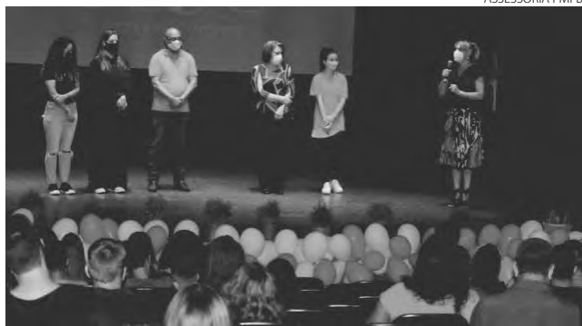
O Centro da Juventude é mantido pela prefeitura, através da Secretaria de Assistência Social

O Centro da Juventude fica no Bairro Pinheirão (Cidade Norte). É mantido pela prefeitura, através da Secretaria de Assistência Social. Atualmente atende 200