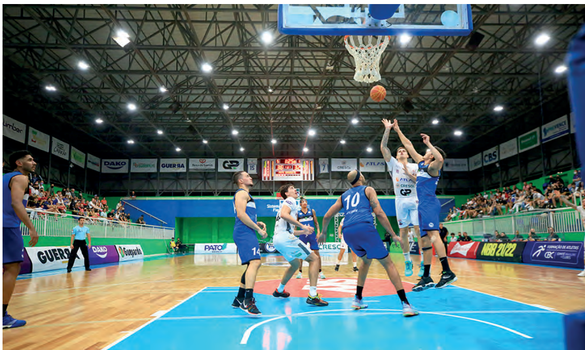
Jogo foi disputado no Ginásio do Sesi