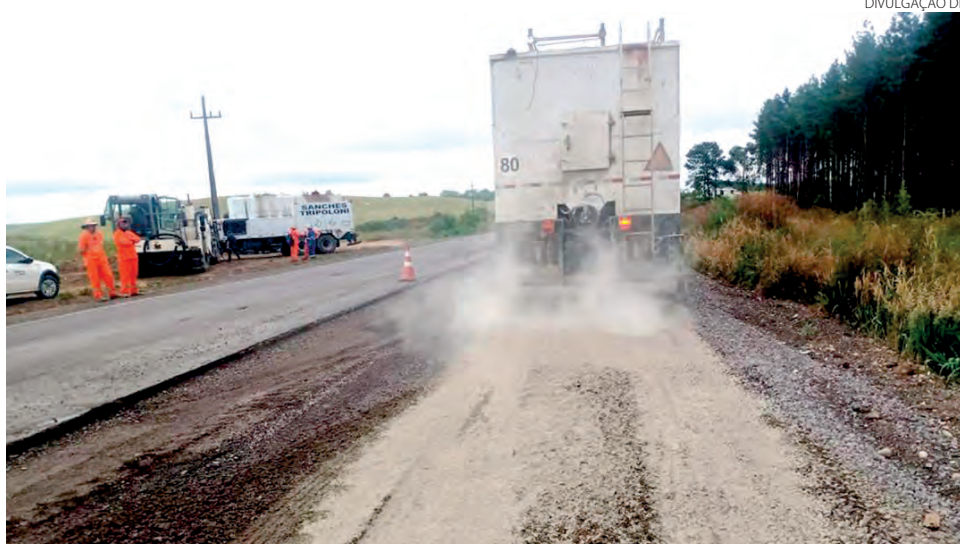
Até o momento, são 12 quilômetros concluídos com serviços de fresagem na pista

A restauração tem um investimento de R$ 107,4 milhões e faz parte do Avanço Paraná, programa do Go-