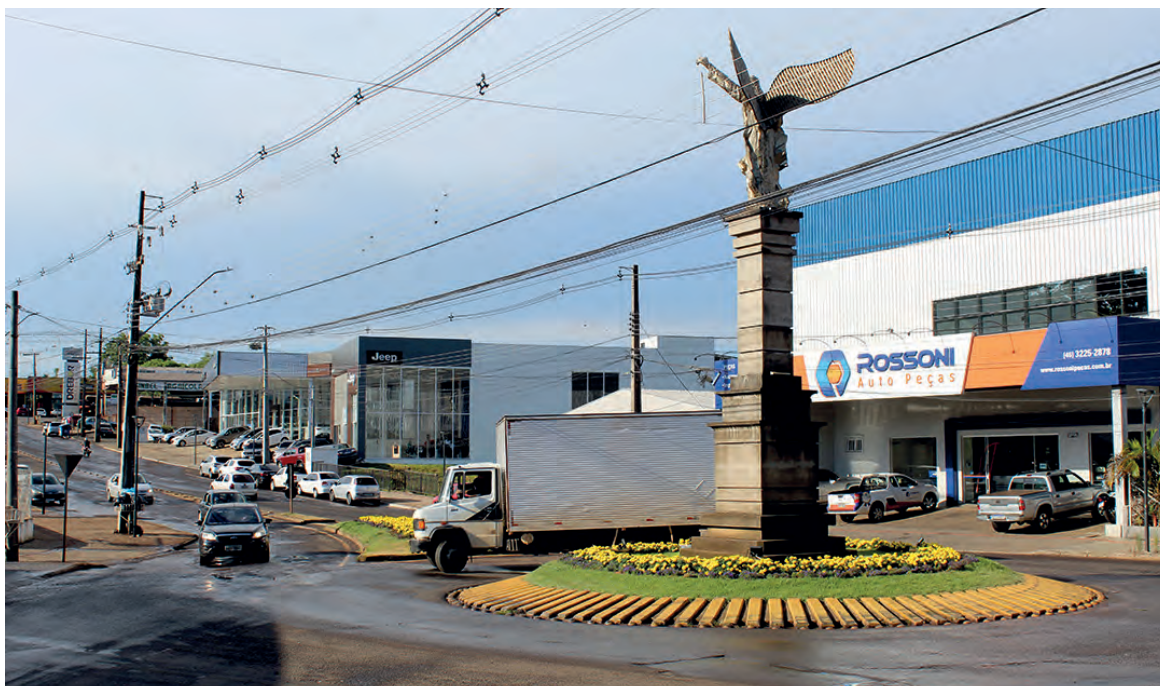
A rotária do anjo deverá ser diminuída, para permitir o fluxo em duas pistas

Também será diminuída a rotatória da Avenida Tupi com a Rua Iguçu, ao lado das lojas Pernambucanas e da praça Presidente Vargas. Além de permitir o melhor