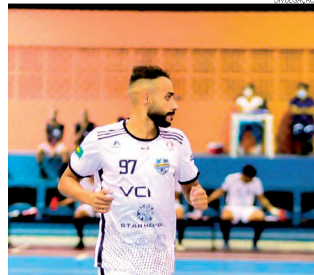
Keel irá defender o Pato Futsal na próxima temporada