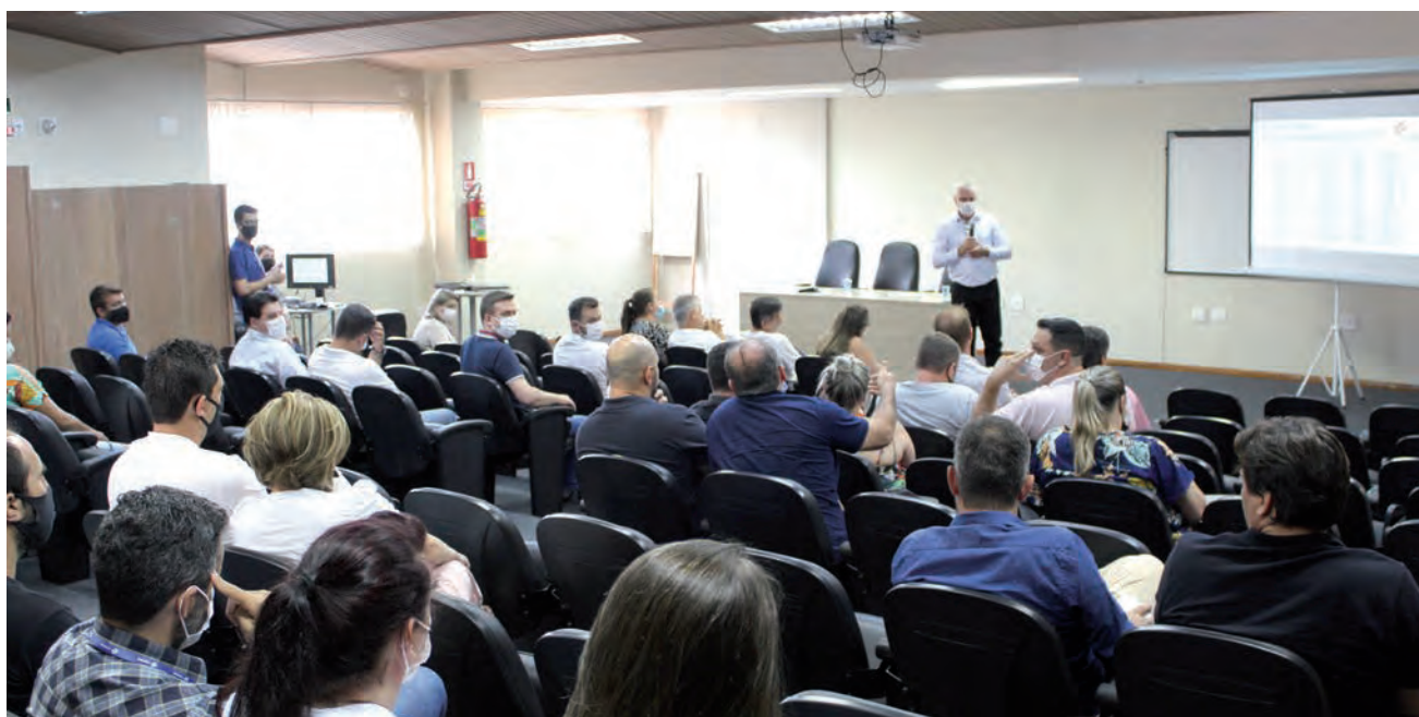
Retorno de Pato Branco foi aprovado por unanimidade