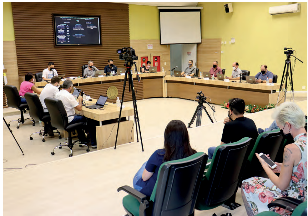
Também na quinta (16) foi realizada sessão extraordinária para votação de redação final de projetos