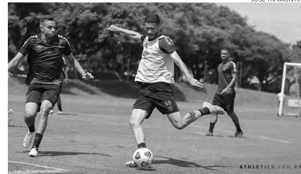
O grupo trabalhou em atividades técnicas e táticas

O Athletico Paranaense treinou terça-feira (1º), no CAT Caju, e está pronto para a segunda partida da decisão da Conmebol Recopa, contra o Palmeiras. O encontro começa às 21h30 desta quarta-feira (2) no Allianz Parque, em São Paulo (SP). Quem vencer, leva o título. Em caso de igualdade, o desempate fica para mais meia hora de prorrogação. Se persistir o empate, o troféu será definido nos pênaltis.