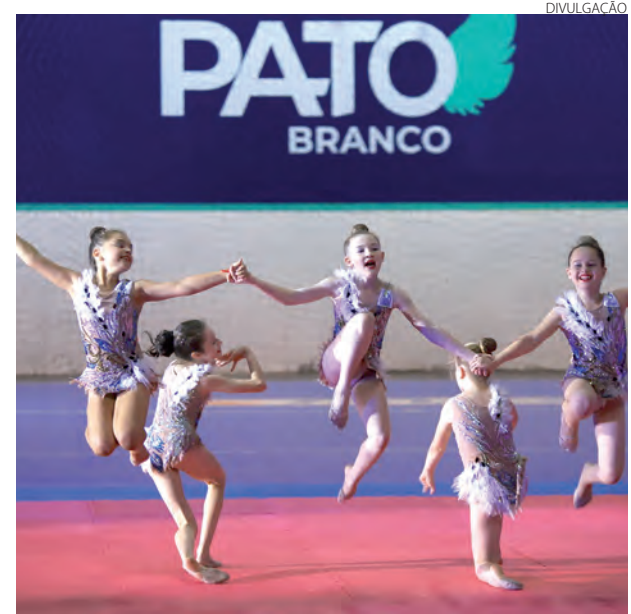
As inscrições somente serão feitas presencialmente