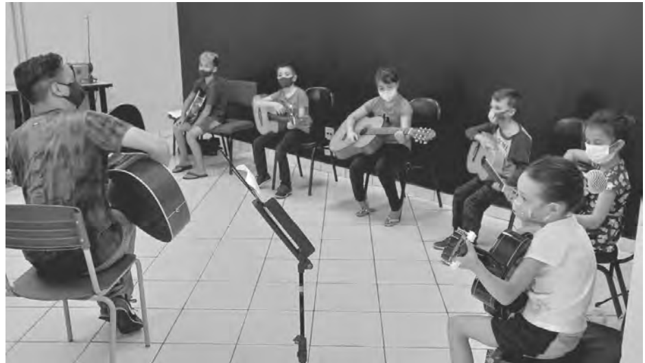
Oficinas atendem aproximadamente 300 alunos