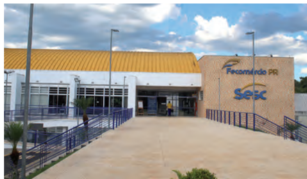
Materiais podem ser doados até 18 de março

A atividade é gratuita. Para participar, é necessário realizar uma pré-inscrição pelo site: www.sescpr.com.br . Informações também podem ser obtidas pelo telefone (46) 3220 - 1750.