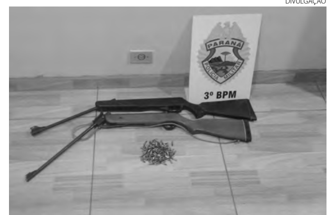
As espingardas e as munições apreendidas em Saudade do Iguaçu

Um conselheiro tutelar de Pato Branco entregou na tarde de segunda-feira no 3º BPM, uma espingarda de pressão adaptada para calibre 22. A arma foi entregue para o conselheiro por um menor de idade morador no bairro São João, que é acusado de disparos de arma de fogo, sendo que ficaram feridas algumas pessoas.