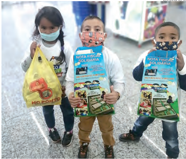
Arrecadação do Nota Paraná auxilia em projetos para 108 crianças que frequentam a entidade