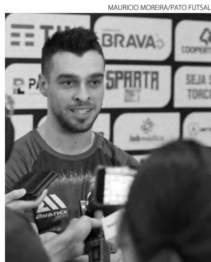
Rangel tem contrato de um ano com o Pato Futsal

Em sua terceira passagem no Pato, Rangel não deixou de comentar a competitividade. “Sabemos que nada