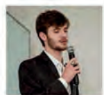
Rotaract Club de Pato Branco Sul