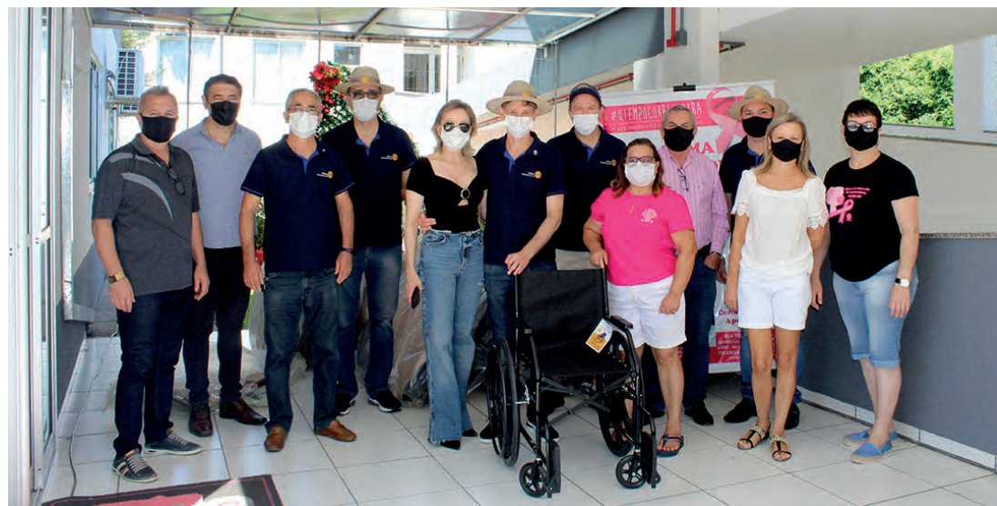
O Rotary entregou as cadeiras de rodas ao Gama na manhã de sábado (18)