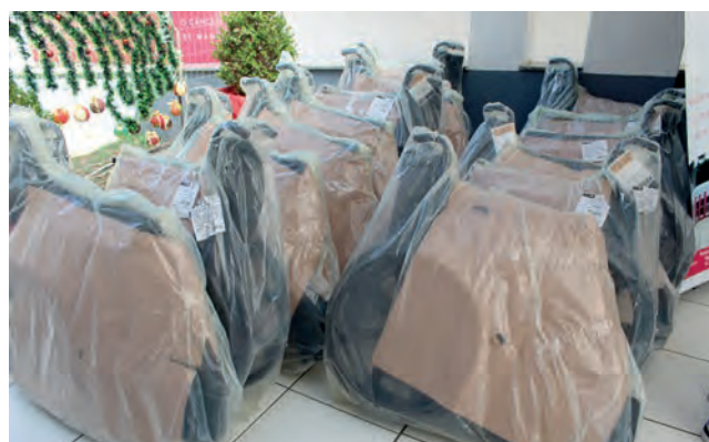
Foram entregues 20 cadeiras de rodas, que vão beneficiar a população que necessita

como uma extensão do corpo da pessoa. Esse benefício do Rotary, mediante ações que a entidade faz com arrecadação de fundos, nesse momento quando estamos passando por um ano de pandemia, poder ofertar essas cadeiras de rodas é um presente de Natal para nós, companheiros do grupo, pela oportunidade de servir para transformar vidas”, ressaltou.