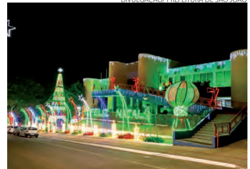
Equipes da 3ª Gincana São João em Movimento embelezam ainda mais o Natal Sanjoanense