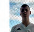
Interact Club de Pato Branco Vila Nova