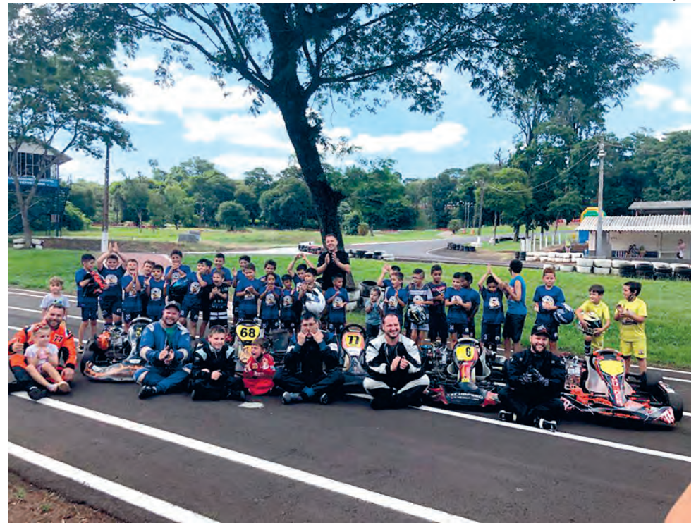
Confraternização de encerramento do ano aconteceu no Kartódromo Municipal Ayrton Senna