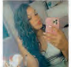
Interact Club de Pato Branco