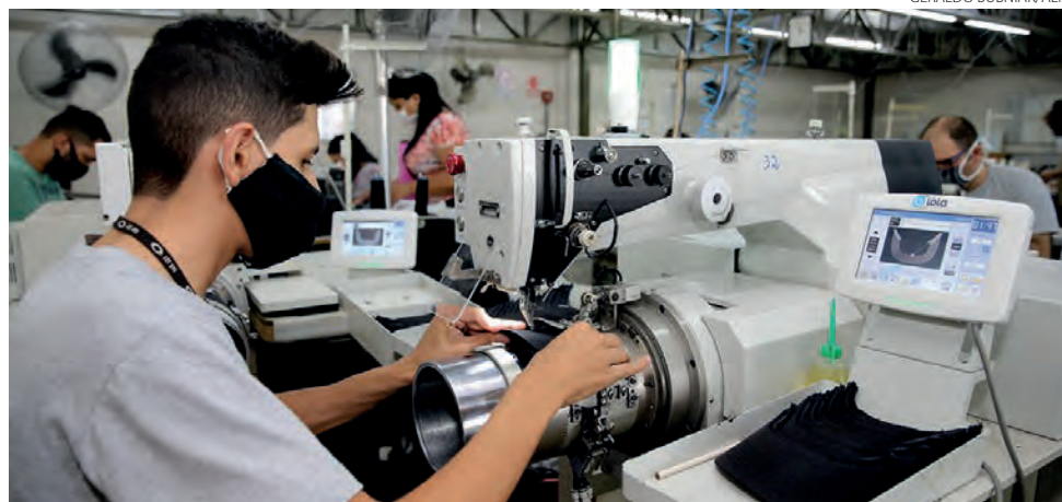
O valor exato será divulgado no início do ano pelo Governo do Estado

A nova base salarial foi definida em consenso pelo