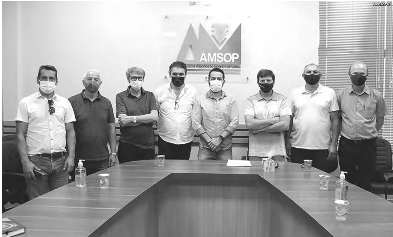
A eleição da nova diretoria aconteceu na última sexta-feira (11), na sede da Amsop, em Francisco Beltrão