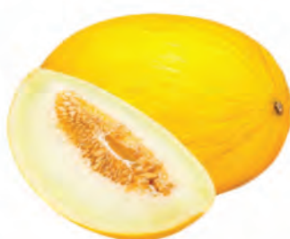
Melão Amarelo Kg