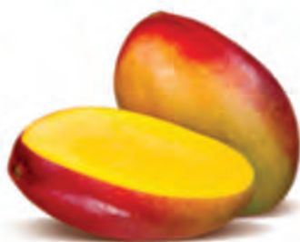
Manga Palmer Kg