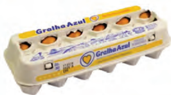
Ovos Vermelho Gralha Azul Dúzia