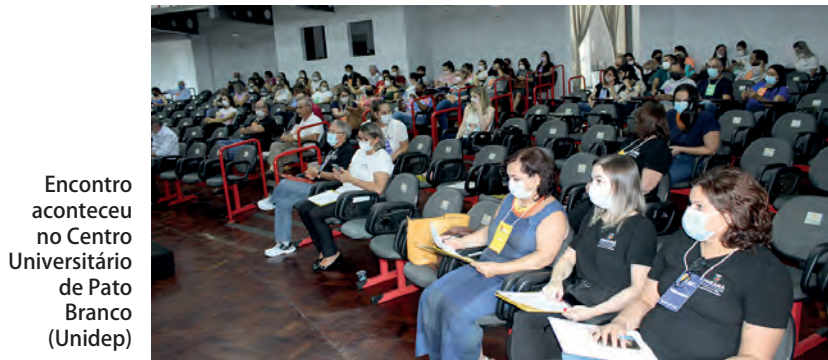
Encontro aconteceu no Centro Universitário de Pato Branco (Unidep)

Nelson da Luz Junior nelson@diariosudoeste.com.br