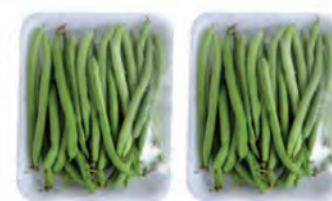
Vagem Lotti Bandeja 300g