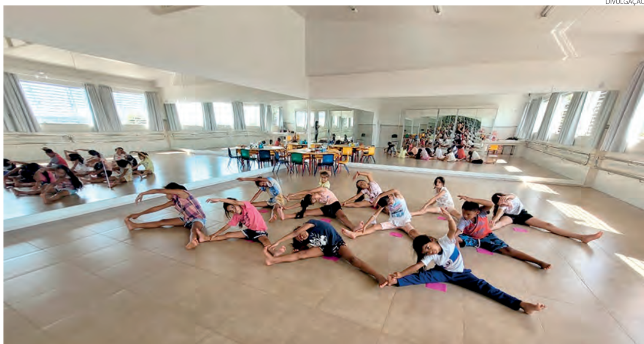
Entidade atende mais de 100 crianças e oferta 15 oficinas

O atendimento presencial retornou de forma gradativa em setembro de 2020 e, atualmente, aconte-