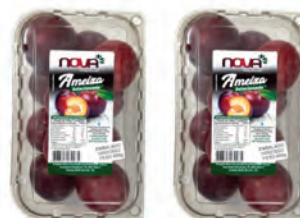
Ameixa Nova Campo Belo Bandeja 600g