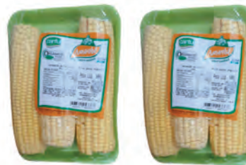
Milho Verde Cantu Orgânico Bandeja 300g