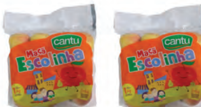
Maçã Escolinha Cantu 1Kg