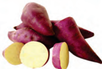
Batata Doce Roxa Kg