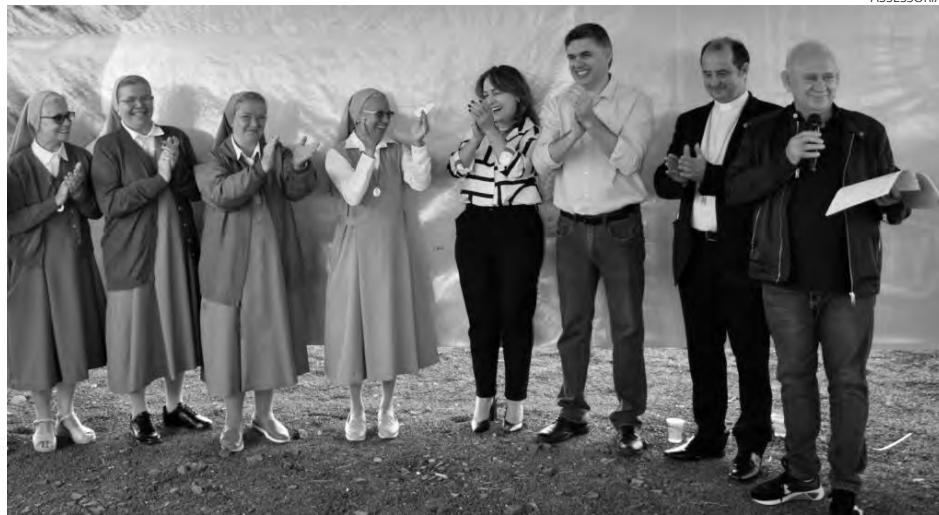
Ato aconteceu no último sábado (29)

Redação com assessoria redacao@diariodosudoeste.com.br