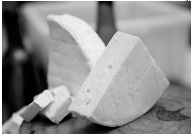
Lançamento do Prêmio Queijos do Paraná aconteceu no Mercado Municipal de Curitiba

O sucesso do Inova Queijo levou os realizadores do evento a lançar programas para continuar o desenvolvimento da cadeia