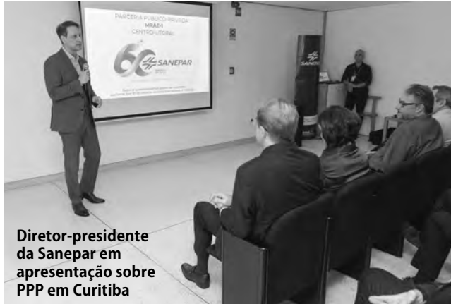
Diretor-presidente da Sanepar em apresentação sobre PPP em Curitiba

Diretores da Sanepar e consultores especializados em gestão fizeram nesta terça-feira (2) apresentação sobre a parceria público-privada (PPP) que será contratada para serviços de esgotamento sanitário em 16 cidades do Centro-Litoral do Paraná. O evento foi no miniauditório do Museu Oscar Niemeyer, em Curitiba, e teve a presença de engenheiros e representantes de empresas de engenharia que podem participar do processo licitatório. As propostas devem ser entregues até 10 de julho.