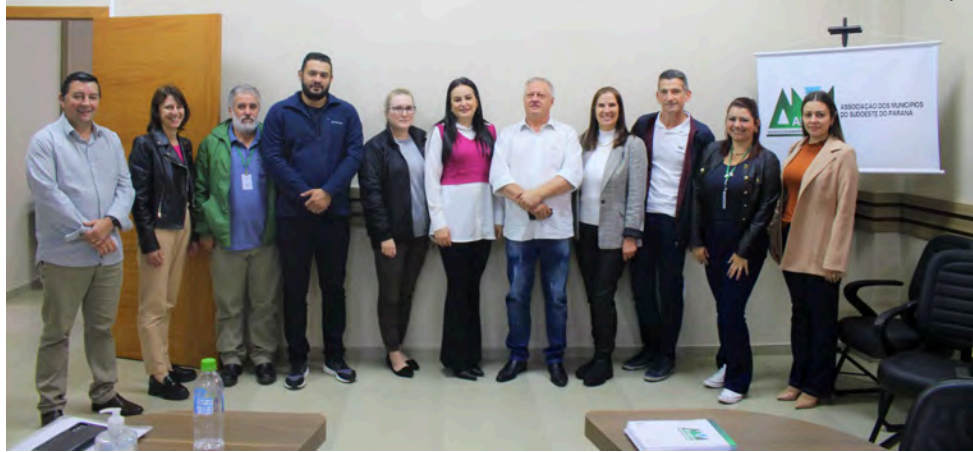
No mesmo dia da reunião em Francisco Beltrão, Lacen confirmou óbito por dengue em Dois Vizinhos

Redação com Assessoria redacao@diariodosudoeste.com.br