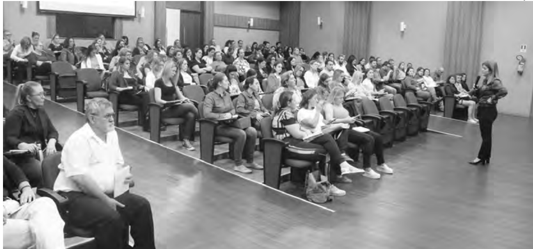
Novo Fundeb está em vigor desde 2020