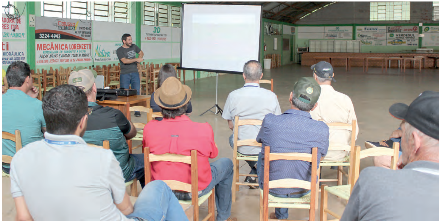
Comunidades rurais de Pato Branco foram divididas em setores para realização dos encontros