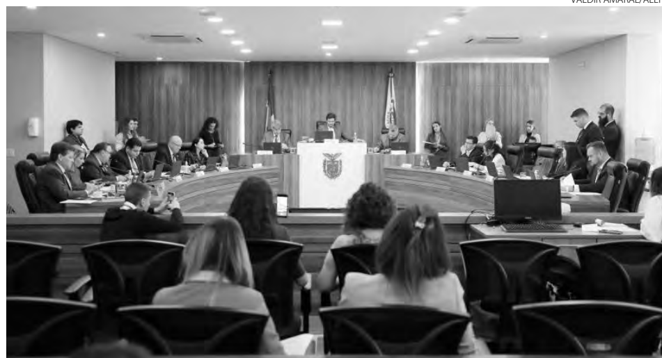
Concessionárias deverão ofertar ao usuário inadimplente, no ato do corte do serviço, a opção de pagamento dos débitos pendentes

De acordo com o texto, as concessionárias deverão ofertar ao usuário inadimplente, no ato do corte do serviço, a opção de pagamento dos débitos pendentes por meio de cartão de crédito, débito ou PIX. O projeto veda a realização da suspensão de fornecimento do serviço caso o agente concessionário estiver desprovido da máquina de cartão para recebimento dos valores devidos. A matéria diz que a opção de quitação deverá ser ofertada no