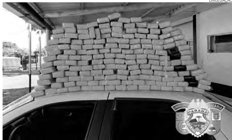
O entorpecente estava sendo transportado em um Fiat/Siena

A Polícia Militar, o BPFron e o Bope apreenderam mais de três toneladas de drogas em ação integrada realizada segunda-feira à noite em portos clandestinos, na cidade de Santa Helena (PR). Os policiais perceberam movimentação de pessoas em um dos portos, mas elas fugiram ao avistarem a viatura e não foram localizadas. No local foram apreendidos 1.430 kg de maconha. Em outro porto clandestino, os policiais encontraram uma embarcação carregada com 1.963 kg