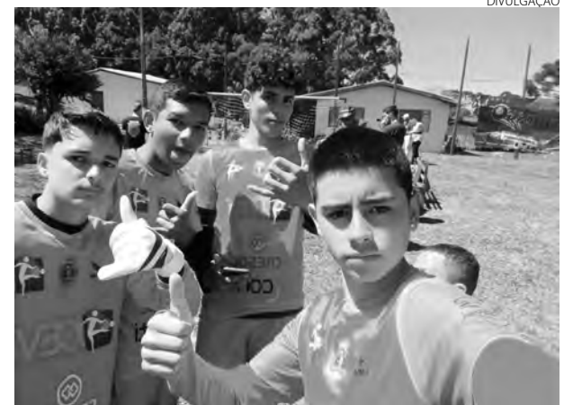
As disputas serão na Associação dos Funcionários Fiscais do Sudoeste do Paraná, em Pato Branco

Na chave A masculino, a disputa está acirrada, com a liderança do Alianza, com 22 pontos, um a mais do Medellín. Tucumã é o terceiro colocado, com 16 pontos. Na chave B, o LZ lidera, com 24 pontos, seguido pelo Corinthians, com 21 pontos. O terceiro colocado é o Tabajara, com 16 pontos. (AB)