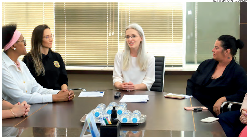
Medidas foram anunciadas na tarde da sexta-feira (14)