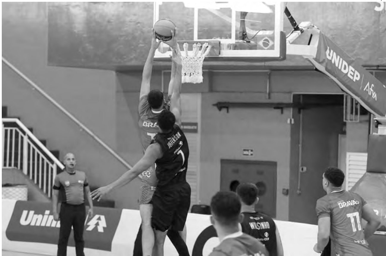
O Pato Basquete recebe o São José segunda-feira no Ginásio do Sesi