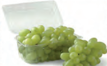
Uva Thompson Bandeja 500g