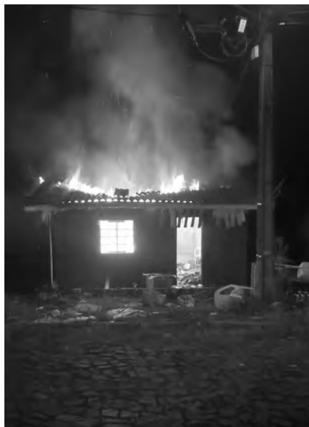
O fogo consumiu grande parte da residência

A equipe policial acionou o Corpo de Bombeiros para combater o incêndio, mas o fogo consumiu grande parte da residência. Os autores do incêndio fugiram novamente e não foram localizados pela Polícia Militar.