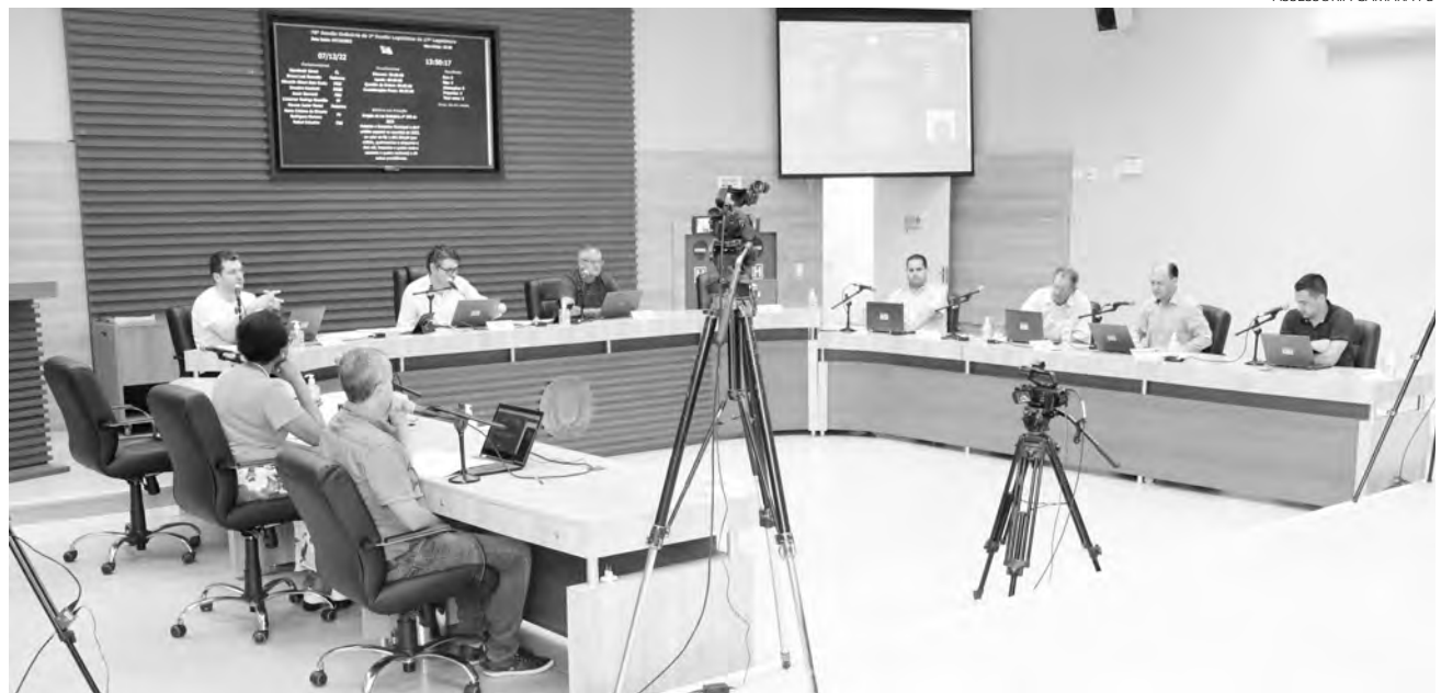
Por meio das emendas os vereadores, na prática, puderam indicar onde os recursos públicos serão gastos em 2023

De prerrogativa dos vereadores, as emendas são divididas entre autorizativas e impositivas. Na prática eles puderam indicar onde