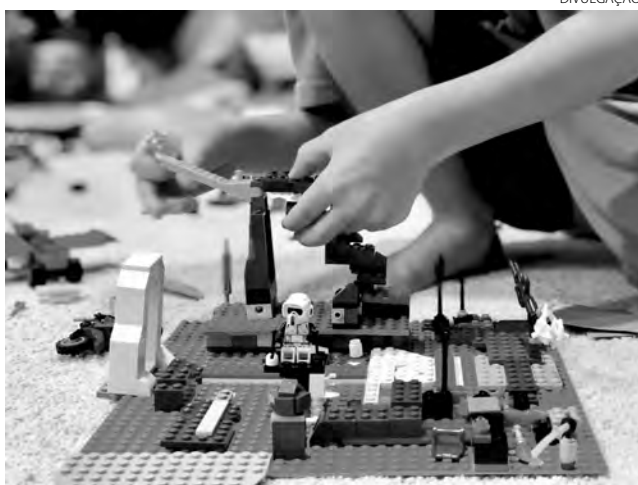
Escola de Pato Branco, foi uma das 38 selecionadas no Brasil

O material será entregue a Associações de Pais e Mestres (APMs) das escolas. Os jogos didáticos serão usados no preparo de crianças para o torneio de robó-