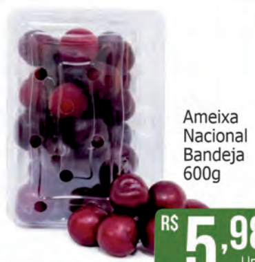
Ameixa Nacional Bandeja 600g