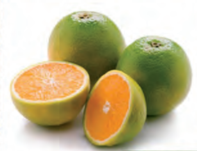
Laranja Pera Kg