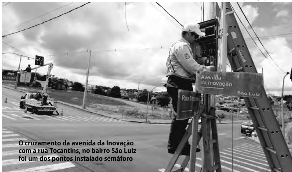
O cruzamento da avenida da Inovação com a rua Tocantins, no bairro São Luiz foi um dos pontos instalado semáforo

bra que no local haverá, também, implantação de sentido único na rua Iguatemi, entre avenida Tupi e rua Ivaí, e na rua Xavier da Silva, entre as ruas Genuíno Piacentini e Pedro José da Silva.