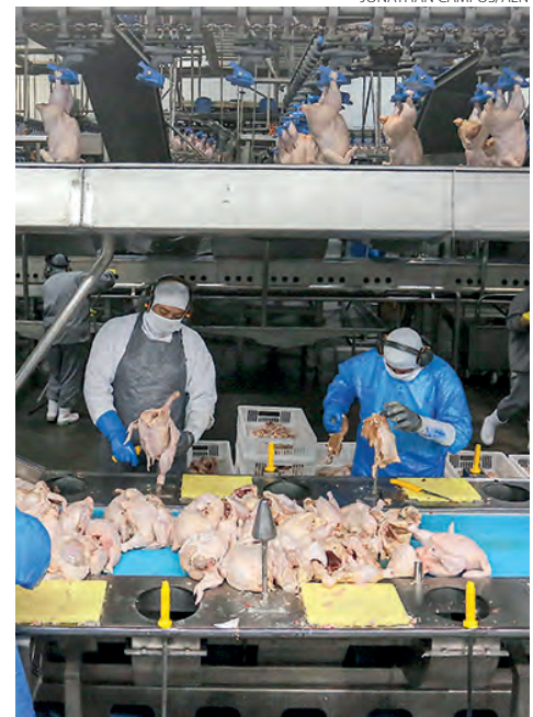
Maiores produtores avícolas do País, a carne de frango teve a maior participação na produção

Além da pecuária de corte, o Paraná também se destaca na produção de ovos e leite, ocupando a vice-liderança nacional