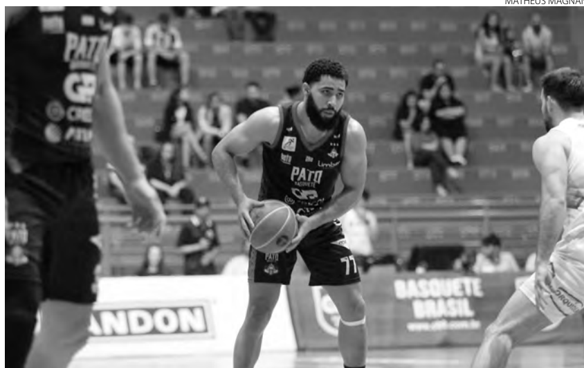
O Pato Basquete foi melhor no segundo tempo e venceu o jogo

O Pato Basquete voltou melhor para o segundo tempo, quando fez 24 pontos no terceiro quarto, contra 17 do adversário e empatou o jogo