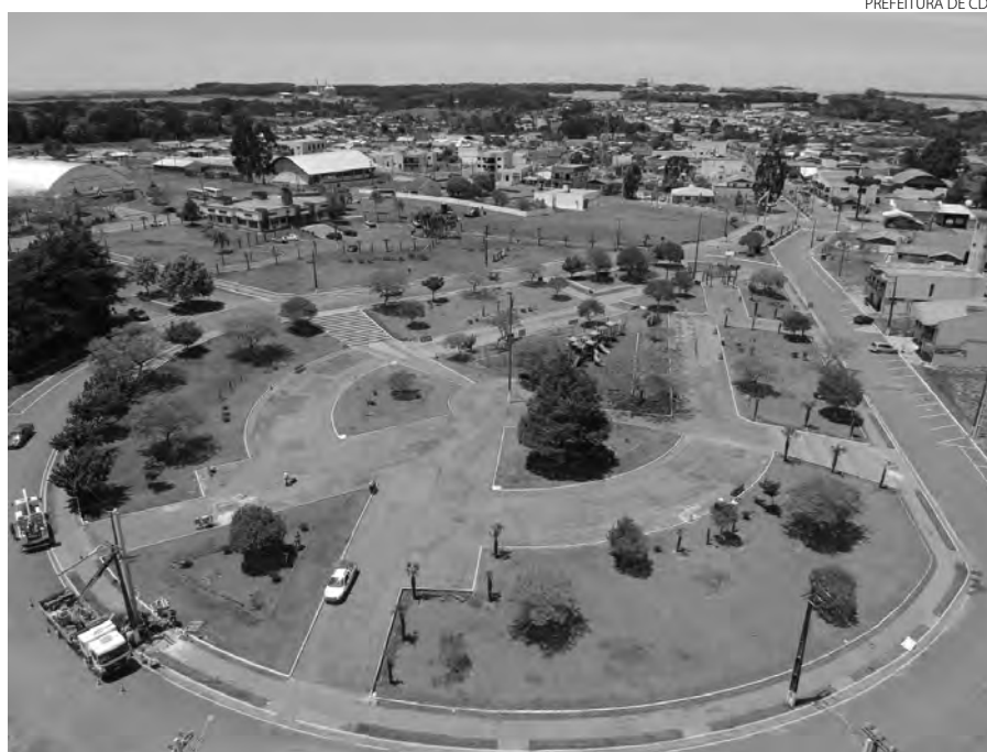
Ultima Expocel aconteceu em 2011

“Depois de 11 anos, depois de mais de 2 anos de pandemia, optamos por realizar este grande evento para comemorarmos não só o aniversário de Coronel Domingos Soares, mas também a vida, a amizade, a saúde, as coisas boas, conquistas e realizações deste período e, claro, deste ano, que apesar das dificuldades foi muito bom para o nosso município”, destaca o prefeito.