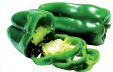
Pimentão Verde Kg