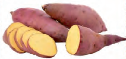
Batata Doce Roxa Kg