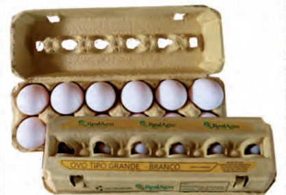
Ovos Brancos Real Agro Dúzia