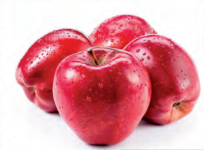
Maça Red Importada Kg