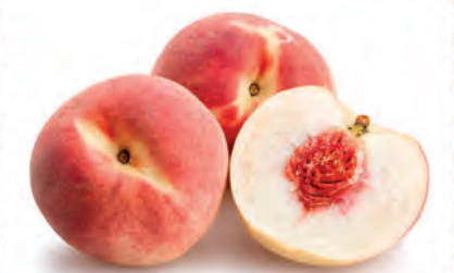
Pêssego Branco Nacional Kg