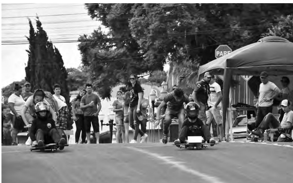
Organização ofertará carrinhos para participantes

Para participar da 3ª Corrida de Carrinhos de Rolimã, os menores de 18 anos devem estar acompanhados de pai ou representante. As inscrições devem ser feitas no dia da corrida, a partir das 13h.