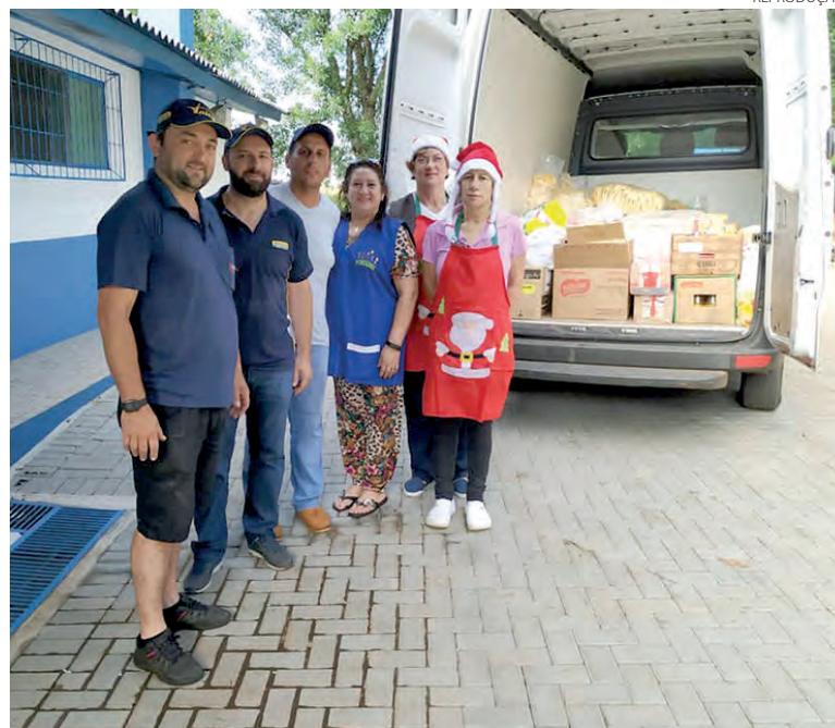
Grupo recolhe doações de alimentos para duas entidades

O trajeto para a arrecadação desse ano terá início no Parque de Exposição, às 9h do sábado, com pontos estratégicos de coleta de alimentos. Os interessados em doar alimentos não perecíveis poderão ir até um desses pontos, localizados na Ecológica Aquecedor Solar, na Autoelétrica Borsatti, na Turin Insumos e no Posto Guara-