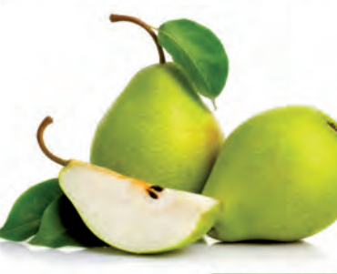
Pera Importada Kg