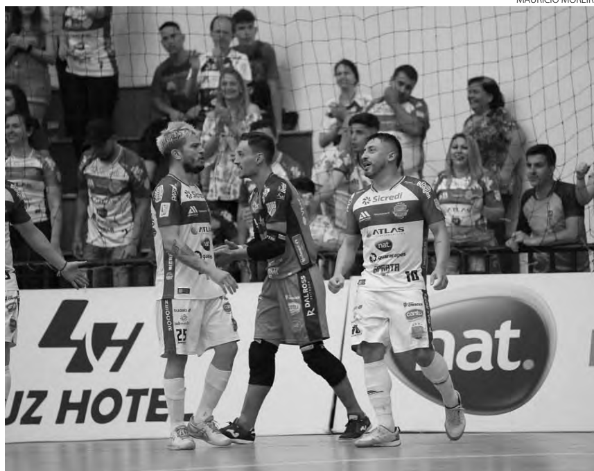
O Pato Futsal busca o segundo título na temporada

A equipe do Pato Futsal fecha a temporada de jogos nesta quinta-feira (8), quando decide a Copa Paraná de Futsal 2022. A final contra o Campo Mourão está marcada para às 19h30, direto da Arena Albertina Salmon, em Paranaguá (PR). Atual campeão da Copa do