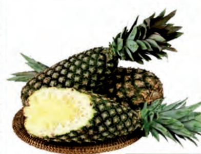
Abacaxi Pérola Unidade