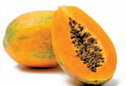
Mamão Papaya Kg