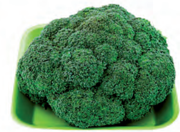
Brócolis da Ilha Bandeja