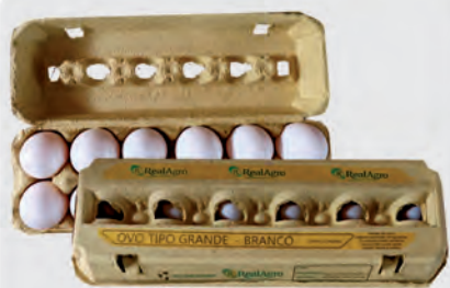
Ovos Brancos Real Agro Dúzia