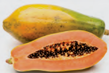
Mamão Formosa Tipo Exportação Kg