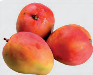
Manga Tommy Kg