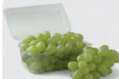
Uva Thompson Bandeja 500g