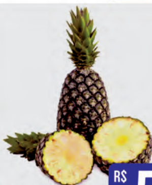
Abacaxi Pérola Unidade