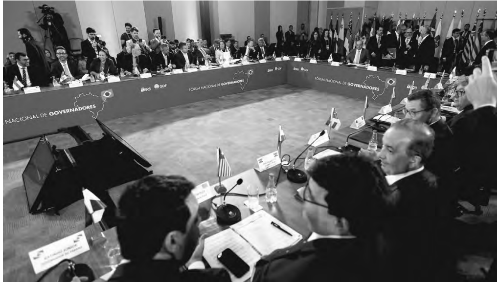
Chefes de Executivo estaduais se reuniram nesta quarta em Brasília