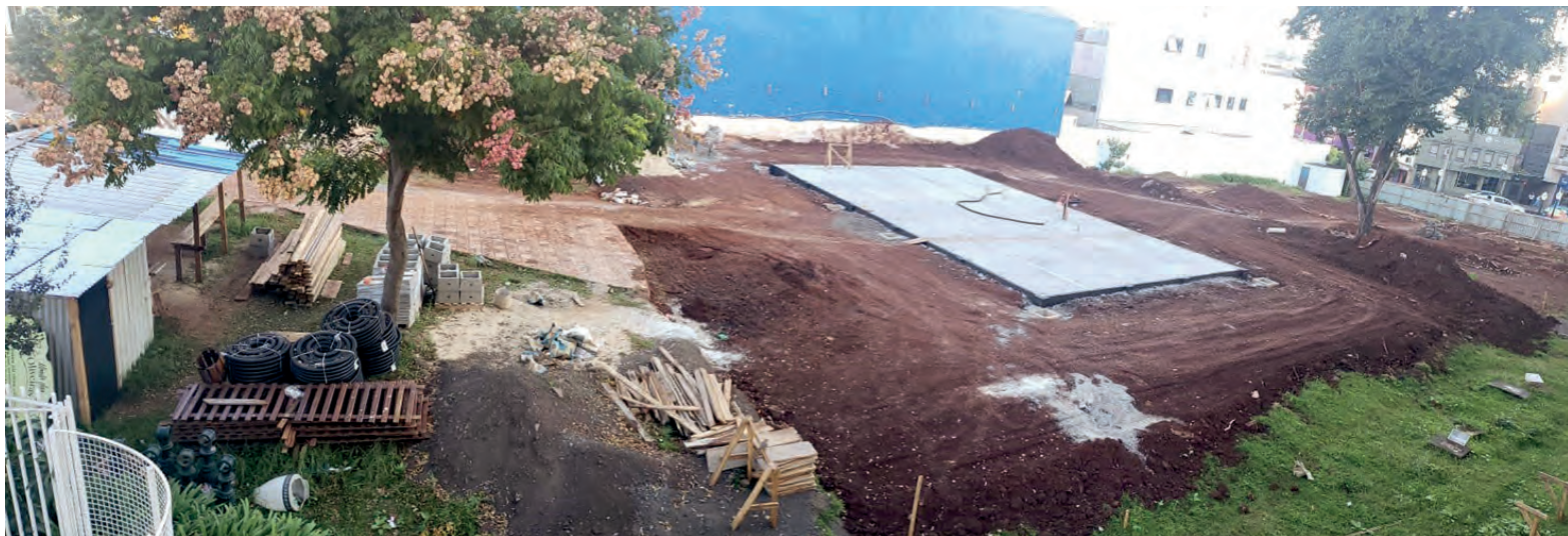
Apenas 0,10% da obra foi realizada até o momento

Ainda, o Departamento apontou que a empresa responsável pela construção e revitalização, a L. RITA - EIRELI, de Dois Vizinhos, foi notificada devido ao não cumprimento do prazo. O valor do