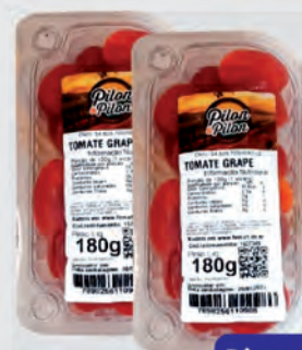
Tomate Cereja Grape Pilon 180g