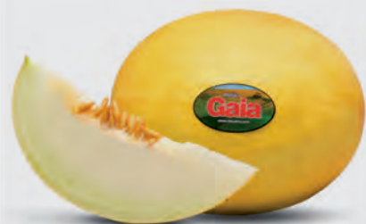
Melão Amarelo Gaia Kg