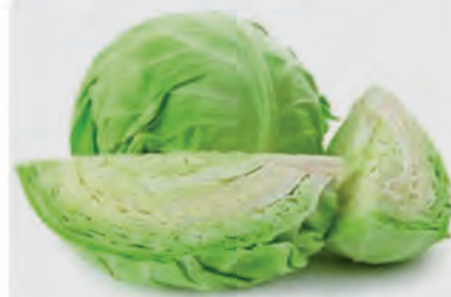
Repolho Verde Kg