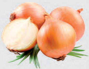
Cebola Nacional Kg