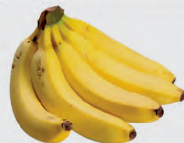
Banana Caturra Kg