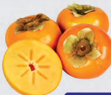
Caqui Fuyu Nacional Especial Kg