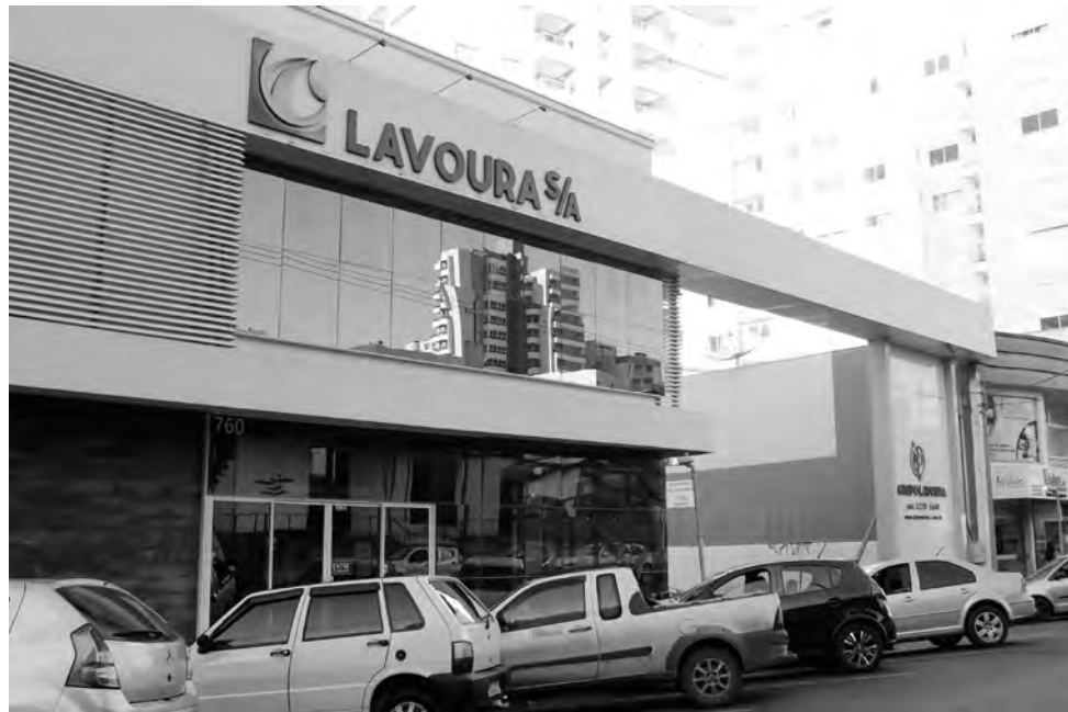
O pedido de Recuperação Judicial do Grupo Lavoura foi apresentado em maio de 2020

A partir da anulação da assembleia para o plano de recuperação, outros encaminhamentos foram dados pelos credores, dentre eles, novas assembleias, onde foram apresentados novos planos para o pagamento das dívidas do Grupo Lavoura.