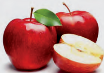
Maçã Gala Cat 1 Kg