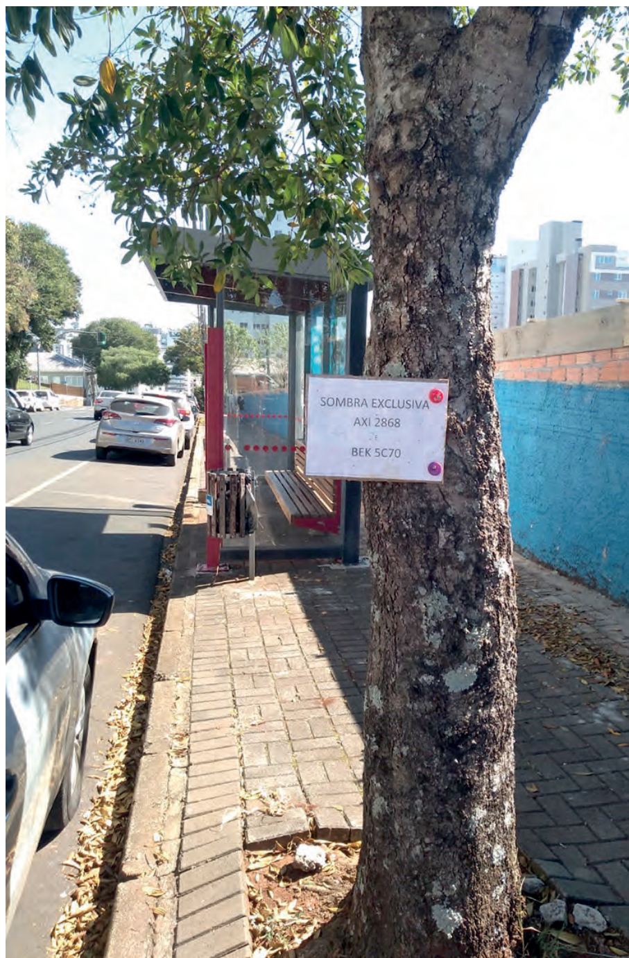
A escassez de sombra é tamanha em Pato Branco, que já tem motorista reservando vaga