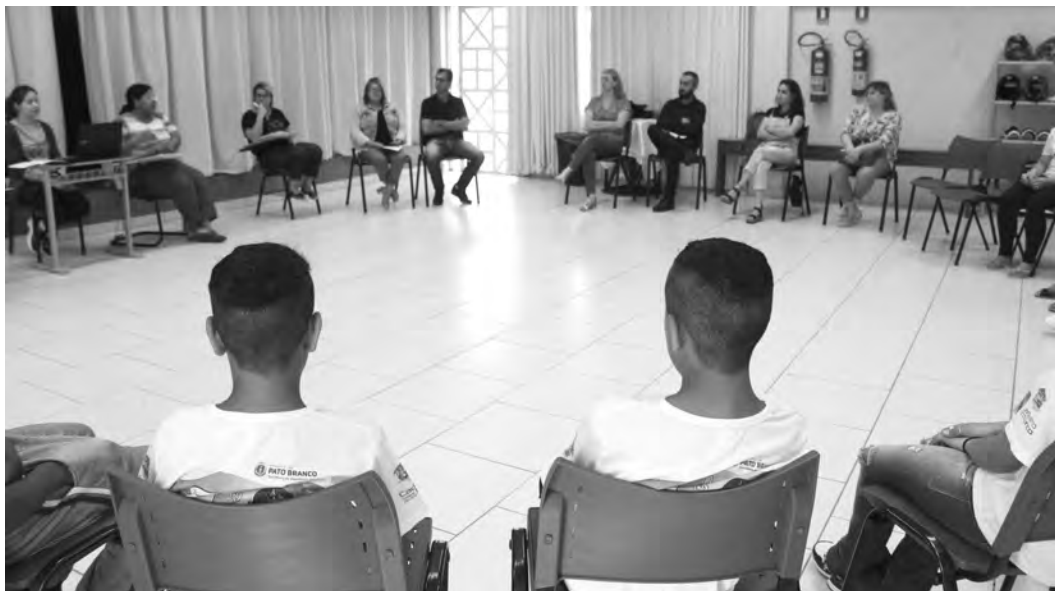
A XII Conferência Municipal dos Direitos da Criança e do Adolescente será em novembro