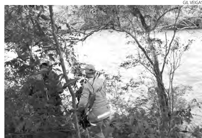
Moradores viram o corpo da jovem enroscado em galhos e acionaram os bombeiros