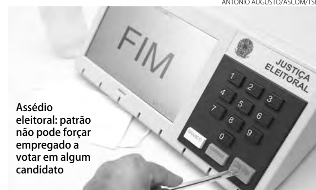
Assédio eleitoral: patrão não pode forçar empregado a votar em algum candidato

O MPT informou que a cooperativa está obrigada a cumprir uma série de exigências com objetivo de coibir o assédio eleitoral em todas as suas unidades, sob pena de multa diária no valor de R$ 200 mil por item descumprido. A decisão da 1ª Vara do Trabalho de Foz do Iguaçu, publicada na segunda-feira (24), atende ao pedido em ação civil pública proposta pelo Ministério