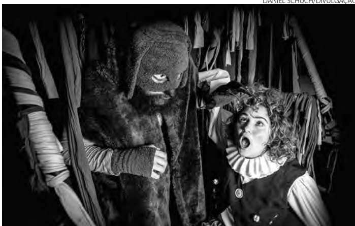
O projeto fará 132 apresentações na primeira edição e o espetáculo desta primeira fase será "A Princesa Cansada e o Animal Bocejante"

Os espetáculos acontecem em Francisco Beltrão (26 a 28), e Pato Branco, de 31 de outubro a 7 de novembro. Além das cidades-sede, o objetivo é atender as crianças de municípios do entorno. Manfrinópolis, Nova Esperança do Sudoeste, Enéas Marques, Verê e Itapejara D'Oeste, na região de Francisco Beltrão, e Bom Sucesso do Sul, Vitorino, Mariópolis e Clevelândia, na região de Pato