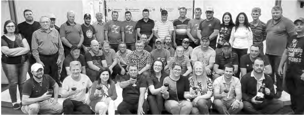
Neste momento, 34 famílias serão beneficiadas com o Revitis Mariópolis.

Os convênios somam um total de R$ 821.063,07 e beneficiam 34 famílias. O repasse dos valores será feito aos produtores, com o objetivo de fortalecer a vitivinicultura de