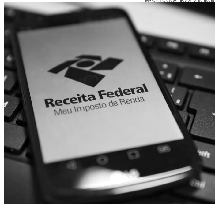
Número de envios bate recorde após mudança de prazo

te é a ampliação dos dados disponíveis na declaração pré-preenchida. No ano passado, o acesso havia sido estendido a quem tem conta nível prata ou ouro no Portal Gov.br. Agora, o formulário, que proporciona mais comodidade e reduz as chances de erros pelo contribuinte, terá mais informações, como imóveis registrados em