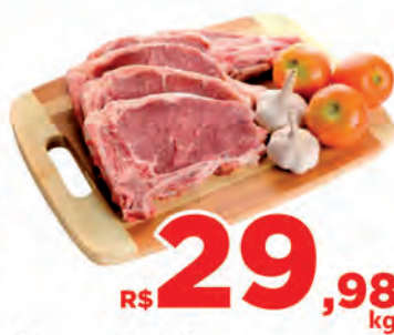
R$ 29,98 kg Carne Bovina Filé Simples c/osso Kg