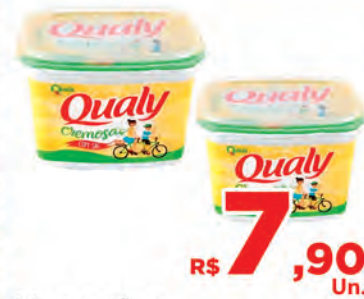
R$ 7,90 Un. Margarina Qualy c/sal 500g