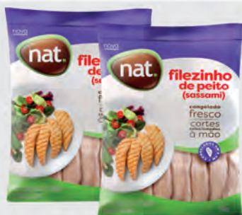
Filezinho Peito Frango Sassami Nat 1Kg