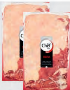
Costela Bovina Janela do Chef Kg