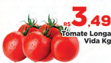
R$ 3,49 kg Tomate Longa Vida Kg R$ 2,98 kg Cebola Nacional Kg