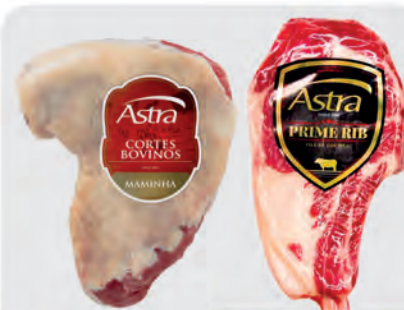
Prime Rib e maminha Astra Bovina Kg