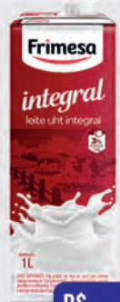
Leite Frimesa Tradicional Integral 1l