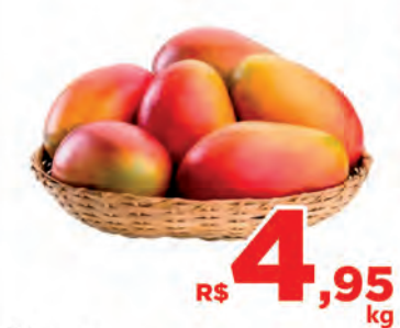
R$ 4,95 kg Manga Palmer Kg