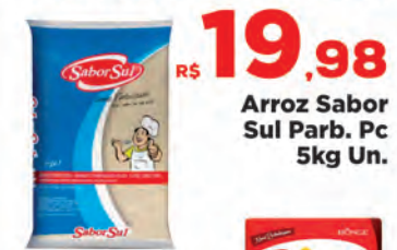
R$ 19,98 5kg Un. Arroz Sabor Sul Parb. Pc 5kg Un.