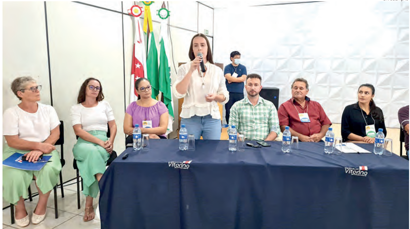
Tema deste ano das conferências de saúde é Garantir direitos e defender o SUS, a vida e a democracia