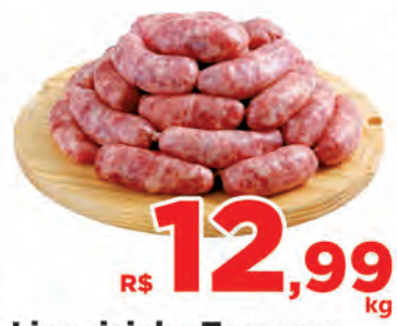
R$ 12,99 kg Linguicinha Toscana Miolar Kg