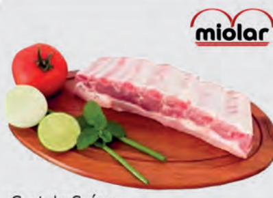
Costela Suína Miolar Temperada s/ Pele Kg