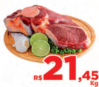
R$ 21,45 kg Carne Bovina Paleta Grossa c/osso Kg