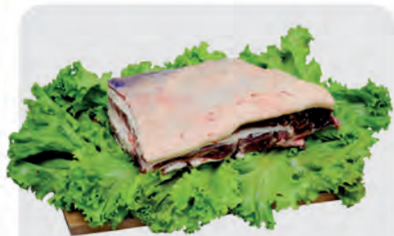
Costela Minga Bovina Kg