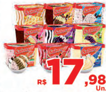
R$ 17,98 Un. Sorvete Sabory 2 Litros

46 3225-4911 - Pato Branco | Horário de atendimento: Segunda a sábado: 8h às 20h | Domingo das 8h às 12h