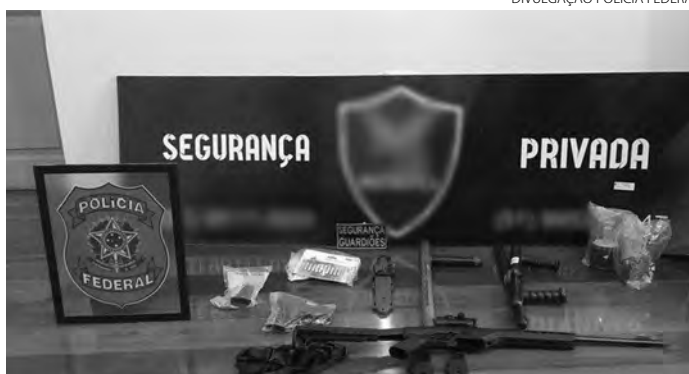
Empresa de segurança é suspeita dos crimes de tortura e ameaça

No local, os policiais encontraram armas de fogo, munições, fardas, cassetetes, capas de colete balístico e material de propaganda. Foram cumpridos nove mandados de busca e apreensão. De acordo com a Polícia Federal, a empresa é suspeita também de ter cometido os crimes de porte ilegal de