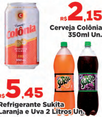
R$ 2,15 350ml Un. Cerveja Colônia 350ml Un. R$ 5,45 Un. Refrigerante Sukita Laranja e Uva 2 Litros Un.