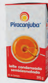
Leite Condensado Semidesnatado Piracanjuba 395g