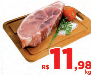
R$ 11,98 kg Carne Suína Paleta c/pele Kg