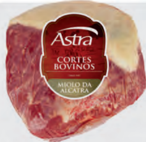
Miolo da Alcatra Bovina Astra Kg