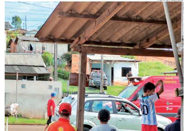
Os dois homens teriam reagido a abordagem quando foram baleados e morreram

DE PERTO, UM CASTELINHO DE AREIA NA PRAIA.