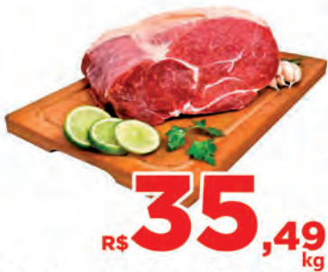
R$ 35,49 kg Carne Bovina Alcatra c/picanha c/osso Kg