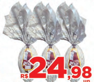
R$ 24,98 un. Ovo Nait 180g