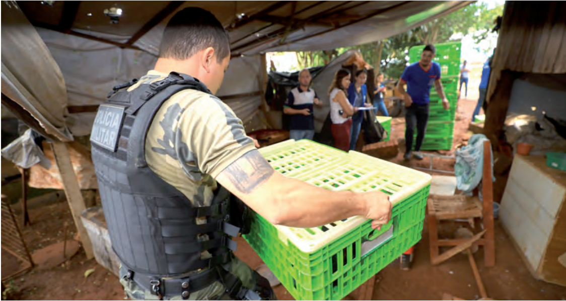
Responsável pelo imóvel onde estavam os animais, recusou diversas recusas de vistorias de órgão competente

Redação com assessoria redacao@diariosudoeste.com.br