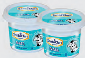
Nata Santa Clara 300g