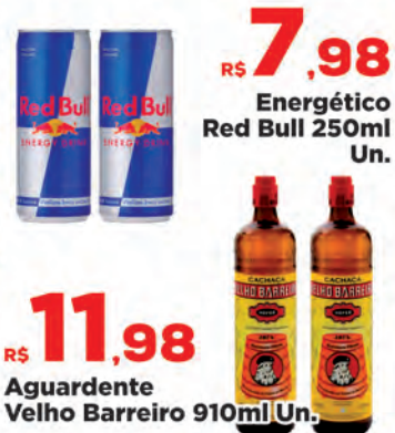
R$ 7,98 Un. Energético Red Bull 250ml Un. R$ 11,98 Un. Aguardente Velho Barreiro 910ml Un.