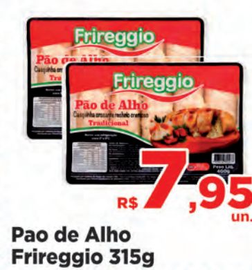
R$ 7,95 un. Pao de Alho Fireggio 315g