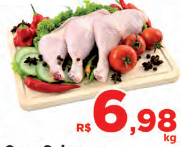
R$ 6,98 kg Coxa Sobrecoxa Congelada Especial Kg