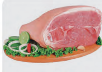
Pernil Suíno c/ Pele Kg