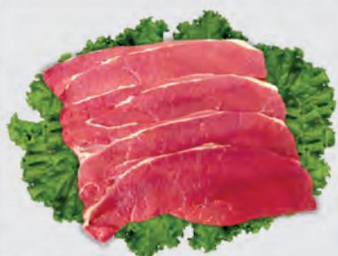
Bife Coxão Mole Bovino Kg