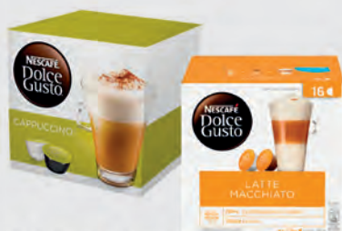
Café Dolce Gusto C/16 Cápsulas Cappuccino e Leite Macchiato