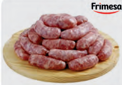
Linguíça Toscana Frimesa Kg