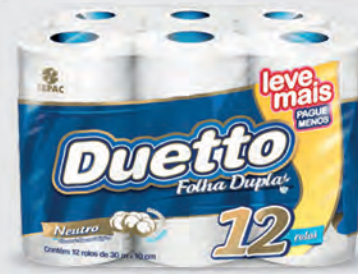
Papel Higiênico Duetto Leve Mais Pague Menos 12 rolos de 30m