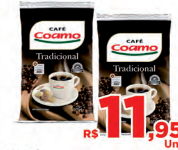
R$ 11,95 Un. Café Coamo 500g