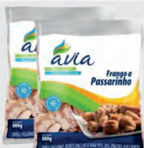
Frango a Passarinho Avia 800g