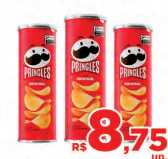
R$ 8,75 un. Batata Pringles 104g