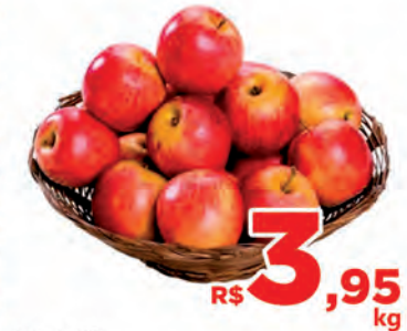
R$ 3,95 kg Maçã Gala Kg