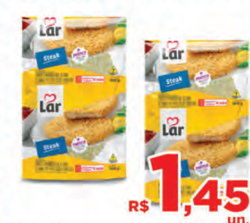
R$ 1,45 un. Steak Lar 100g