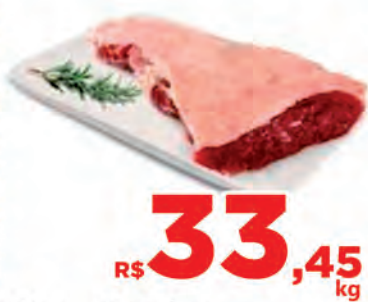
R$ 33,45 kg Carne Bovina Chapéu Bispo c/osso Kg