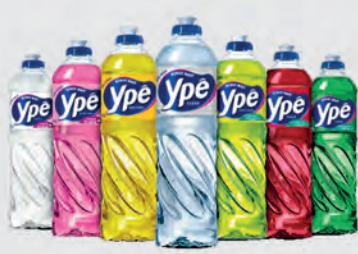
Detergente Líquido Ypê 500ml